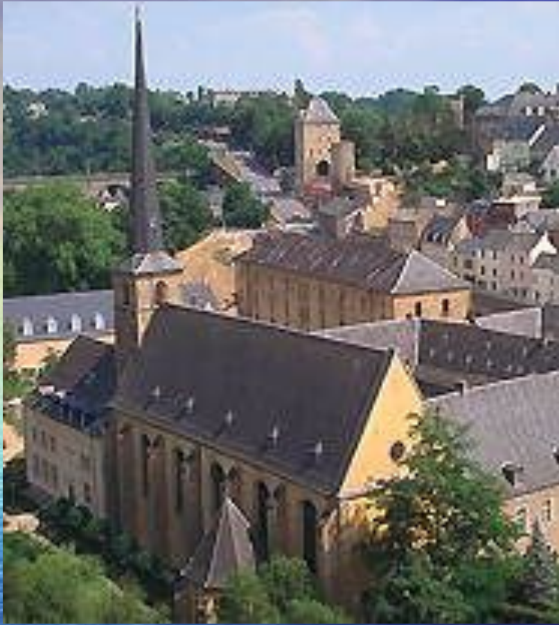
Вид на город