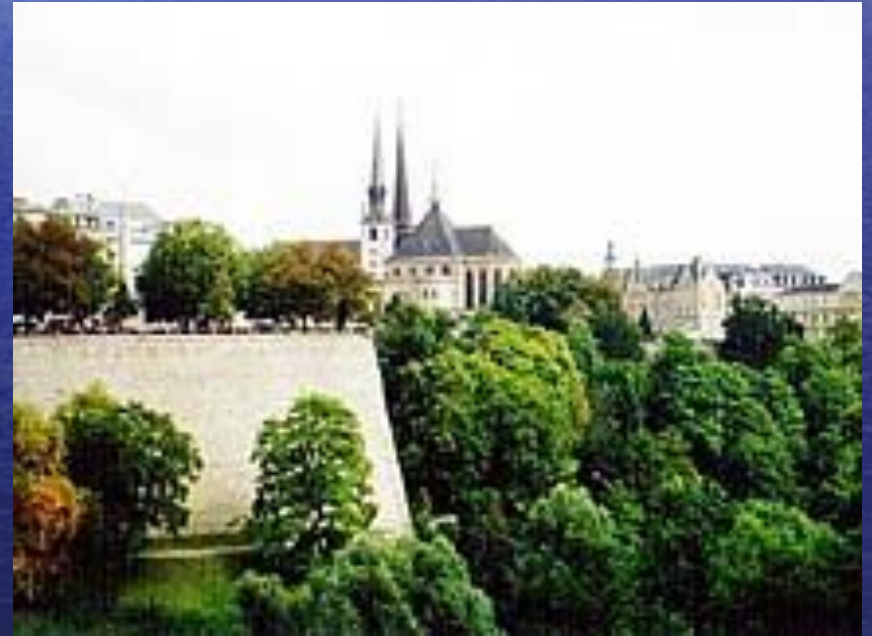
Вид на Нотр-Дам