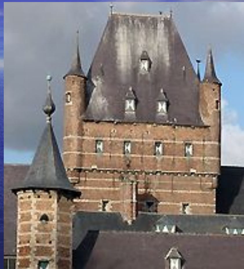
замок Боссенстейн близ Антверпена