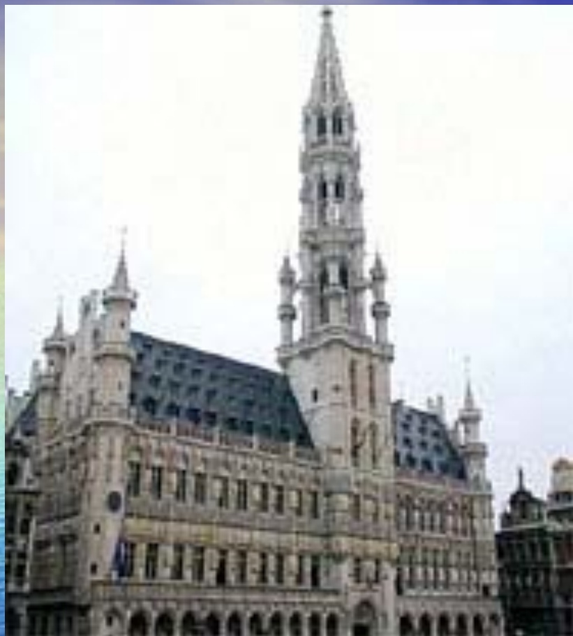
Городская ратуша на Гран-Плас