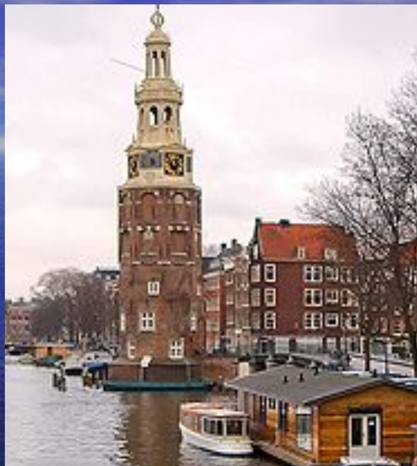
Амстердам. Вид на каналы