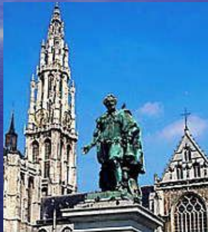
Готический собор Сен Мишель-э-Гюдюль