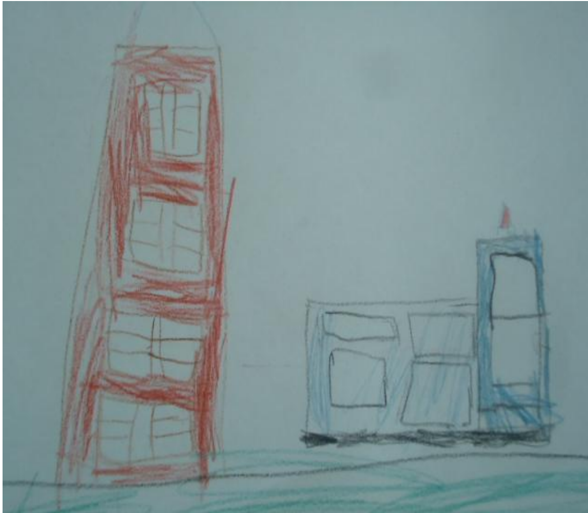
Пикалов Марк 1 класс