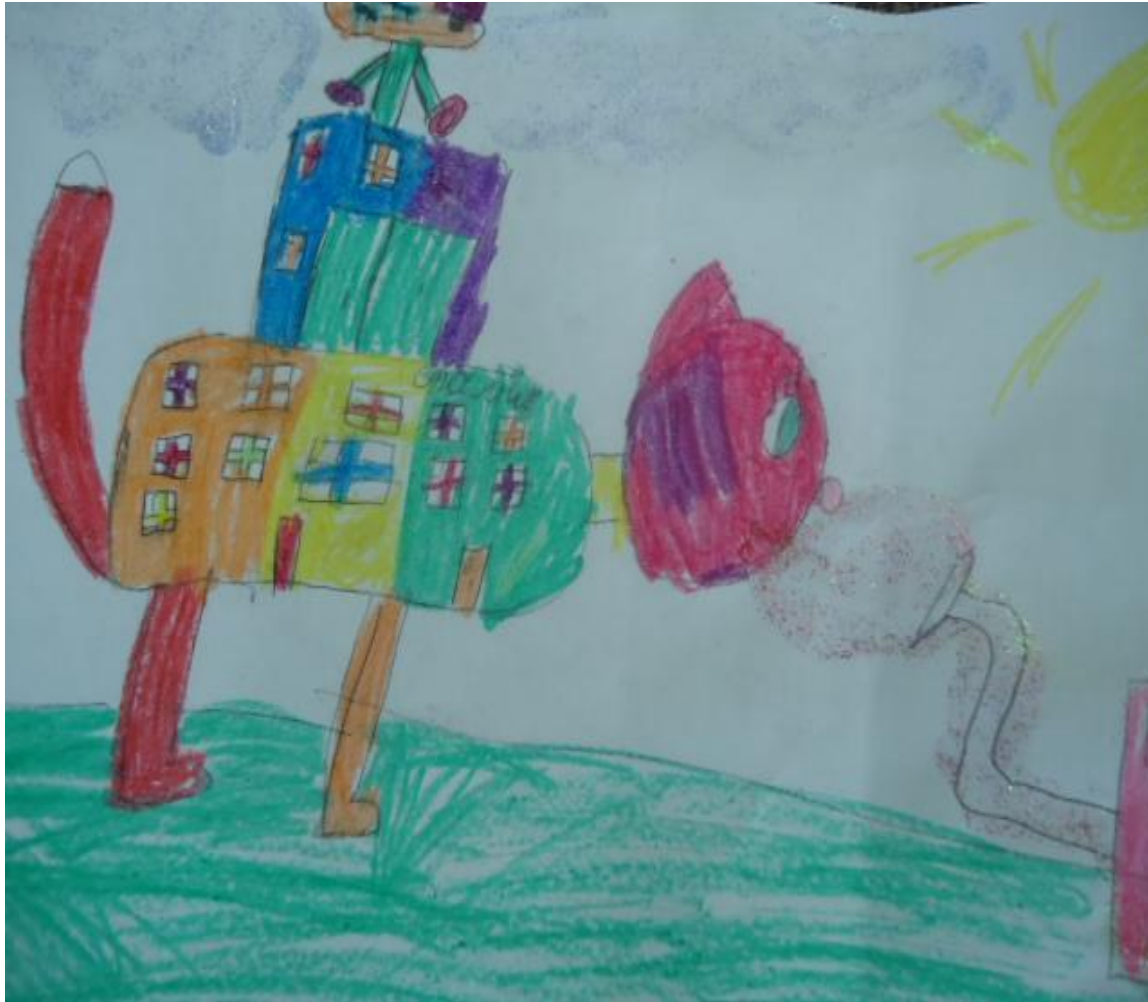
Капустина Вероника 1 класс