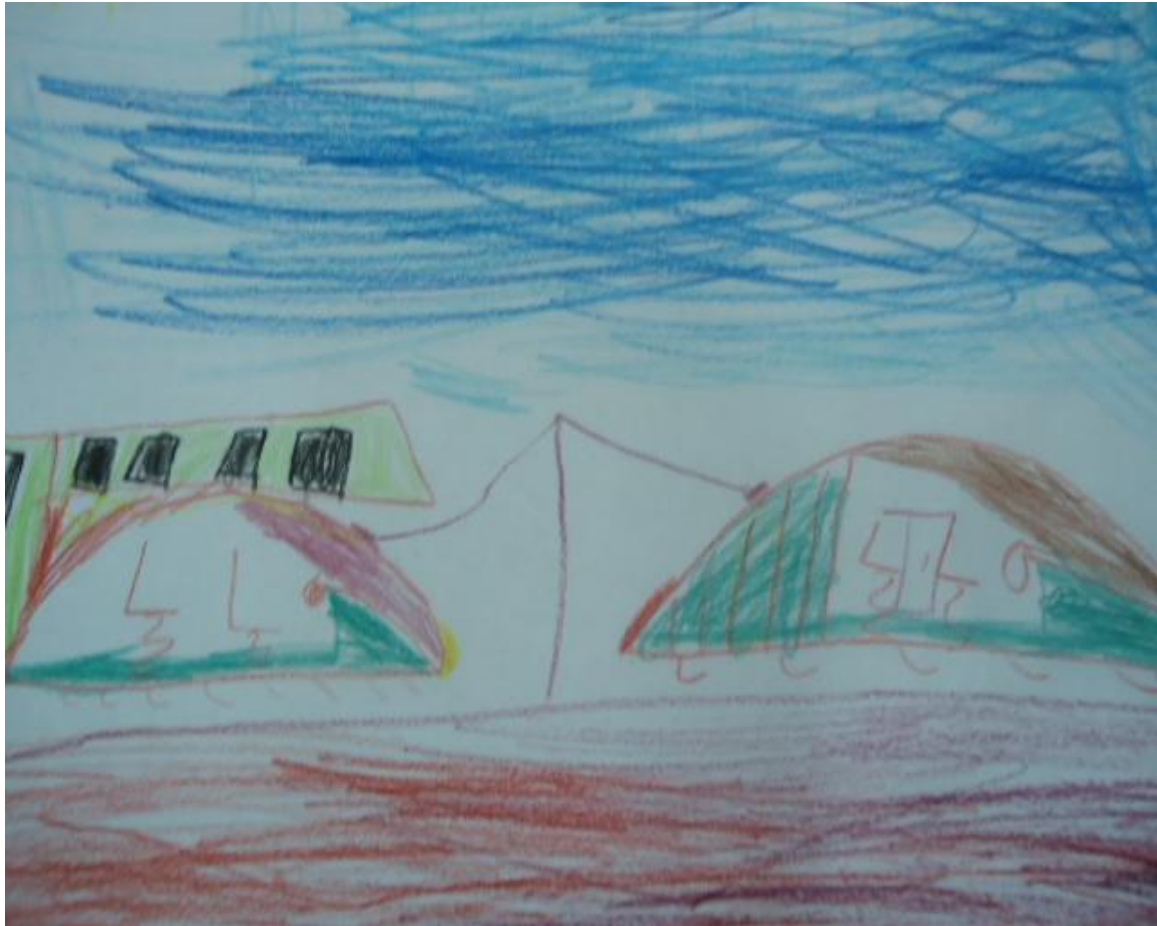
Штейнбрейс Миша 1 класс