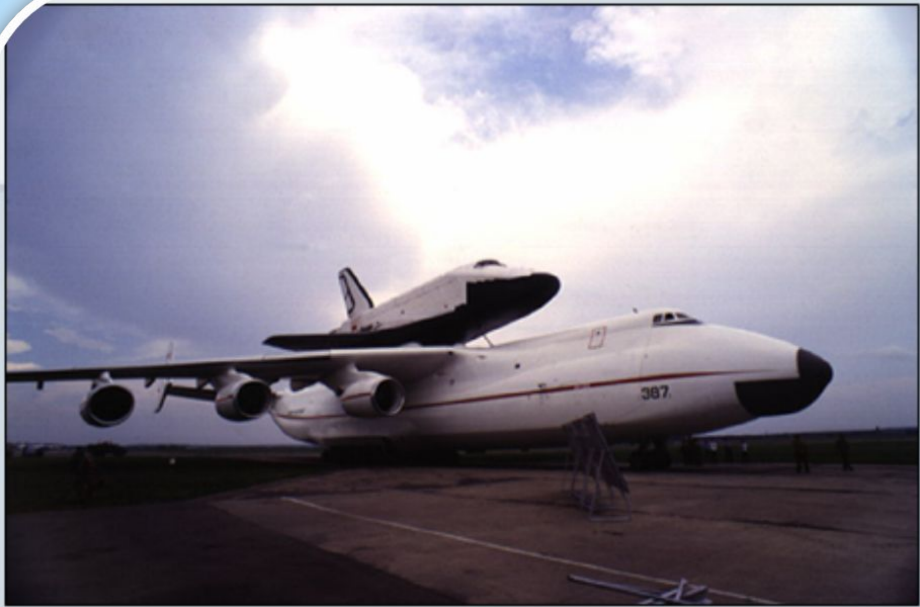
Транспортировка воздушно-космического самолета «Буран»