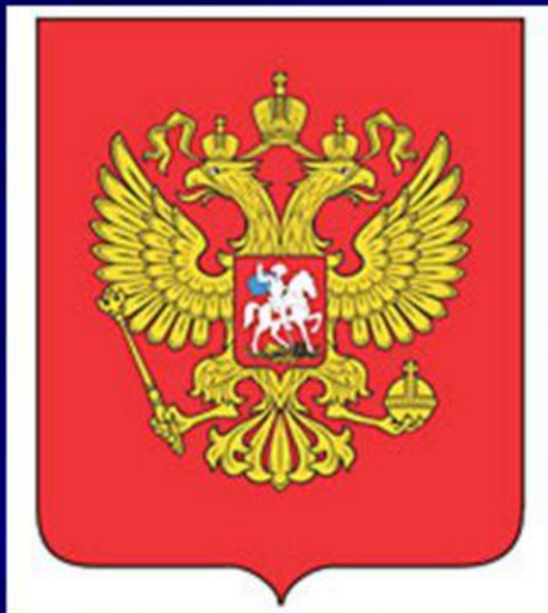
Государственный герб Российской Федерации

Герб – это отличительный знак государства, города, сословия, изображаемый на флагах, монетах печатях и других официальных документах.