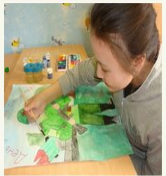
Люди, создающие будущее

"Изюминка" нашего проекта - возможность создать очень быстро и просто персональный мини-сайт.