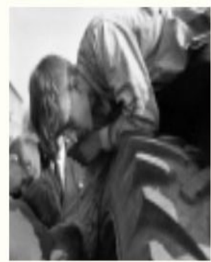
В.А.Сухомлинский. Интерес к