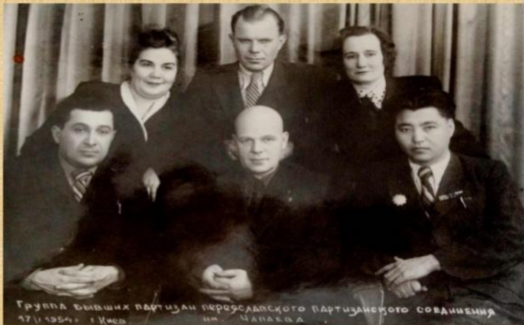
Переяславтық партизандардың Киевте кездесуінде 1954 жыл