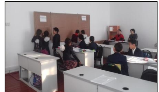
Мәтінді талдау сәті