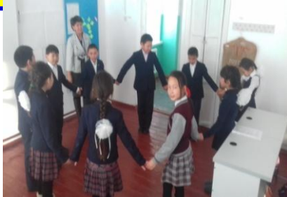
Ынтымақтастық орнату сәті