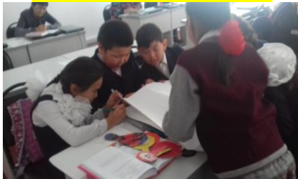
I топтың жұмысы