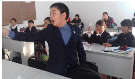
Академиялық дау - дамай