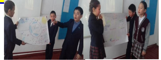
Постерді қорғау сәті