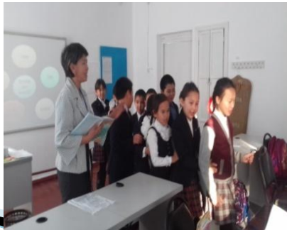
Сергіту сәті “Әрі оқу, әрі ойын”