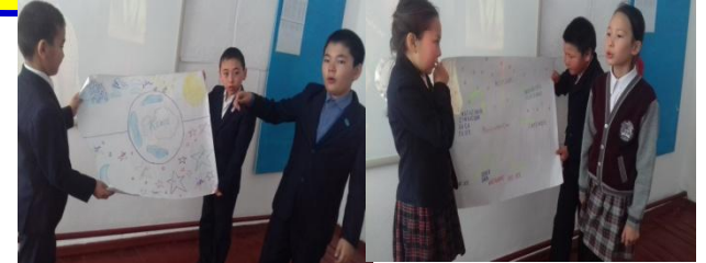
Постерді қорғау сәті