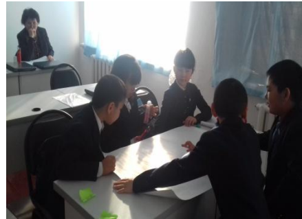
Кластер жасау сәті