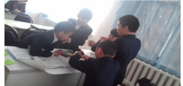
II топтың жұмысы