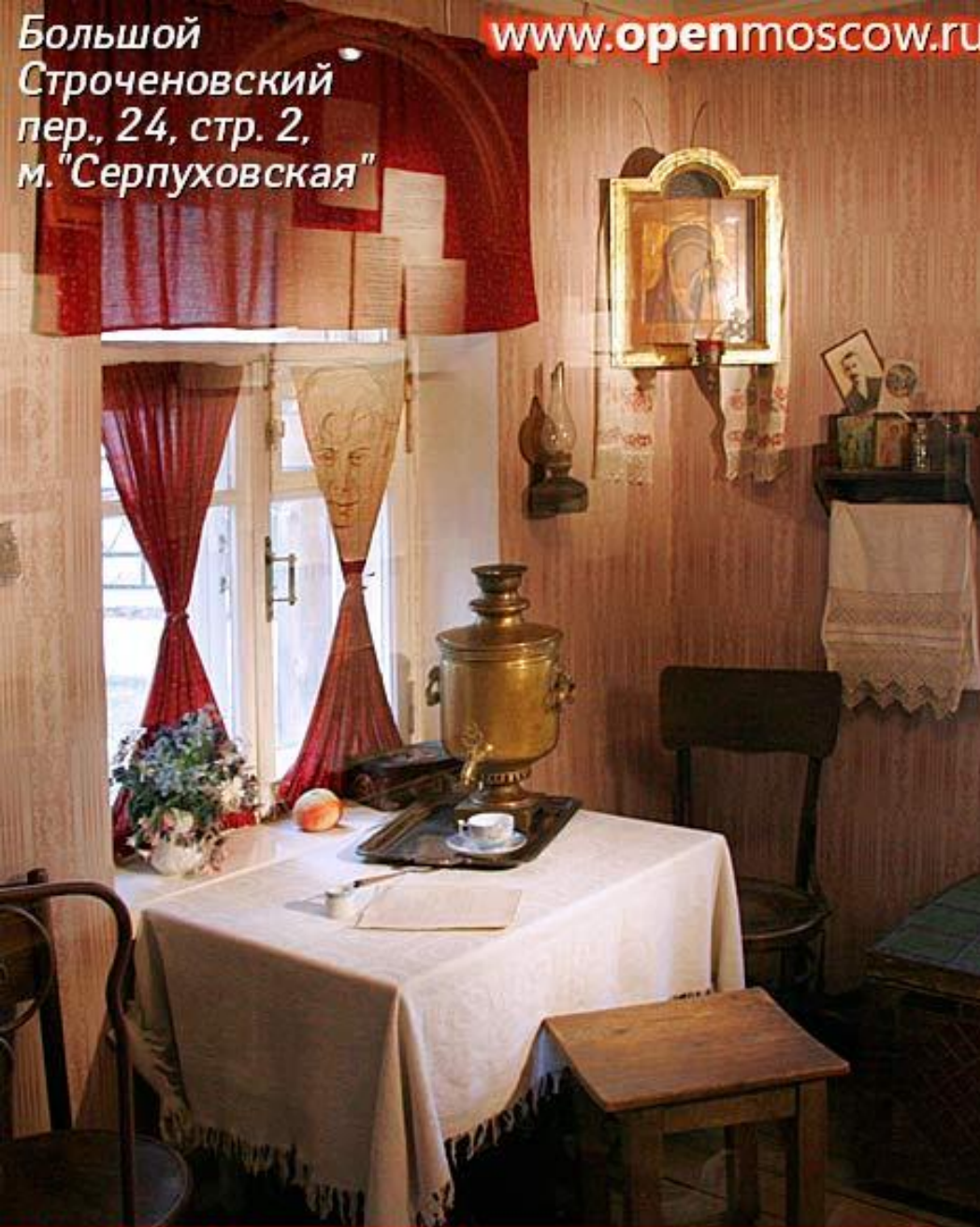
Музей С. А. Есенина Мемориальная комната

Большой Строченовский пер., 24, стр. 2, м. "Серпуховская"