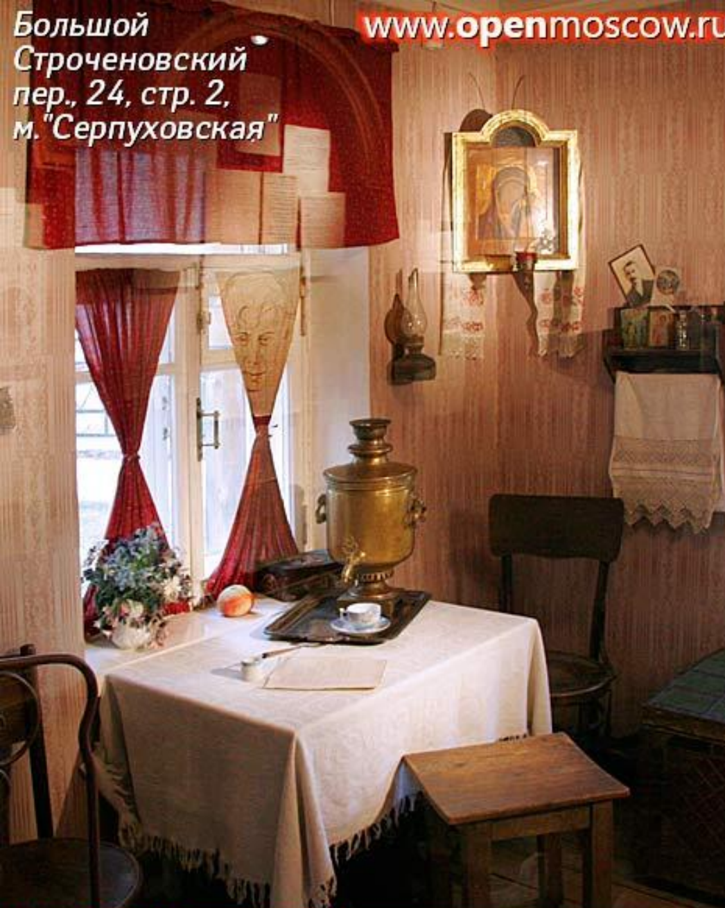
Музей С. А. Есенина Мемориальная комната

Большой Строченовский пер., 24, стр. 2, м. "Серпуховская"