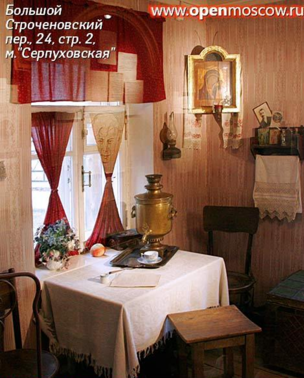
Музей С. А. Есенина Мемориальная комната

Большой Строченовский пер., 24, стр. 2, м. "Серпуховская"