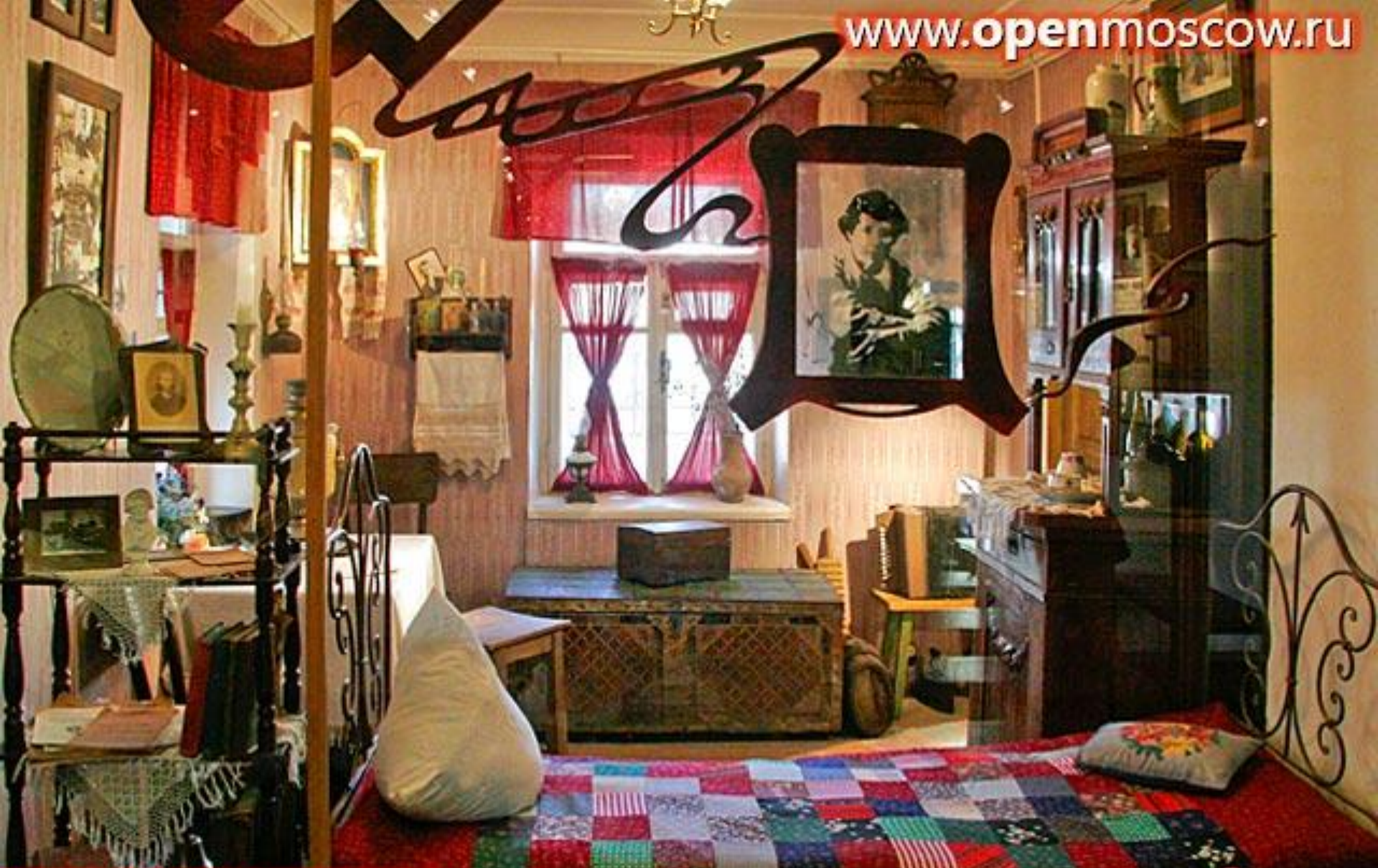
Музей С. А. Есенина Мемориальная комната Большой Строченовский пер., 24, стр. 2, м. "Серпуховская"