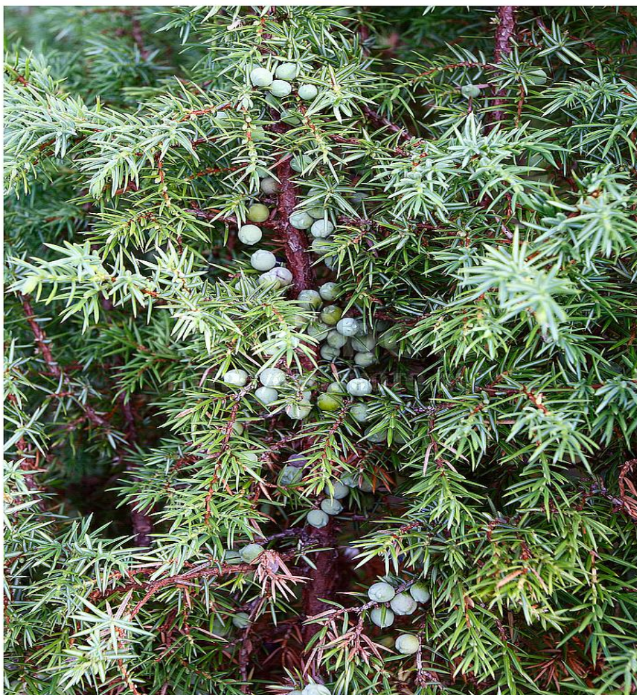
# khh9076065 Flora of the northern part of European Russia