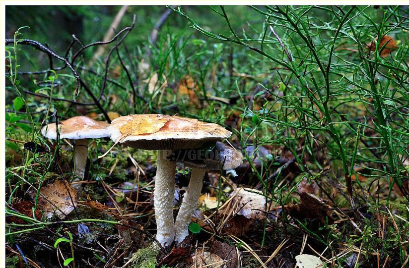
4 kph9976897 Flora of the northern part of European Russia Nikhailov Konstantin (C) GeoPhoto.Ru