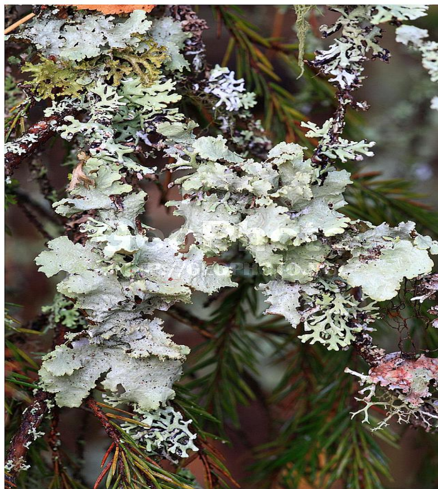
# khh9076075 Flora of the northern part of European Russia