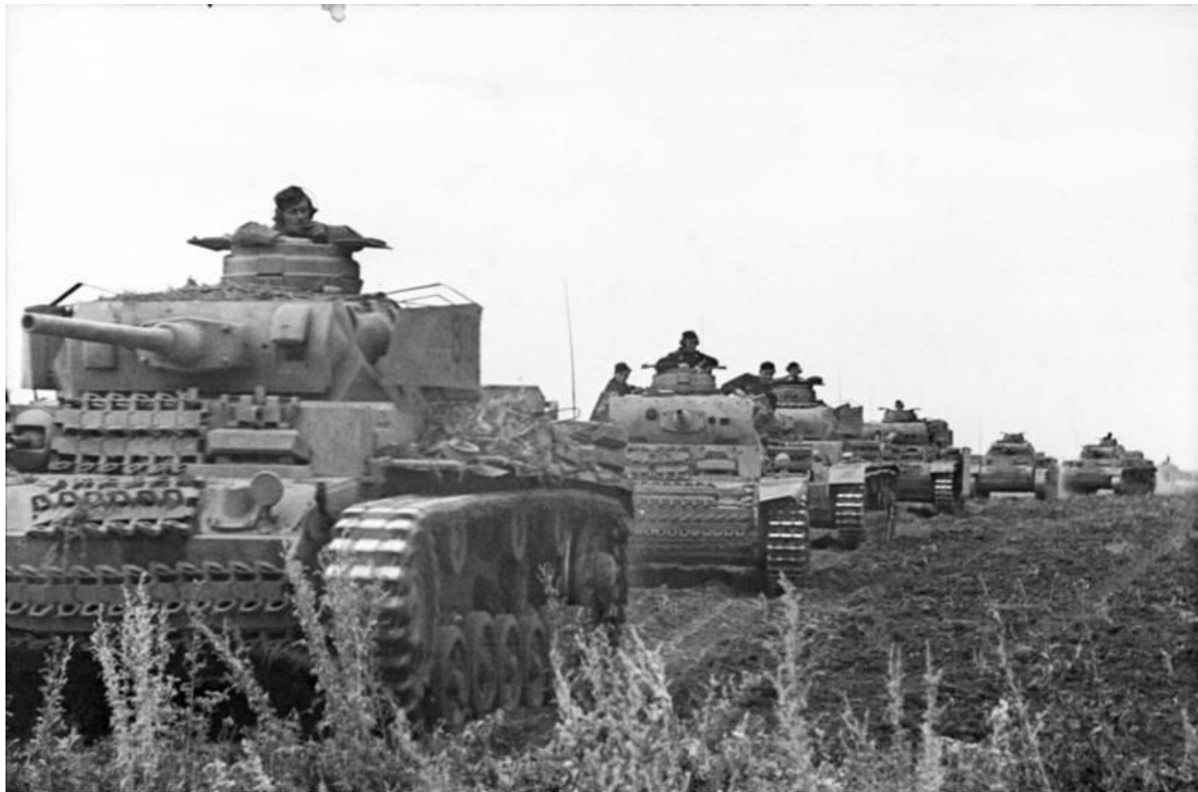
1943 Juni - Juli