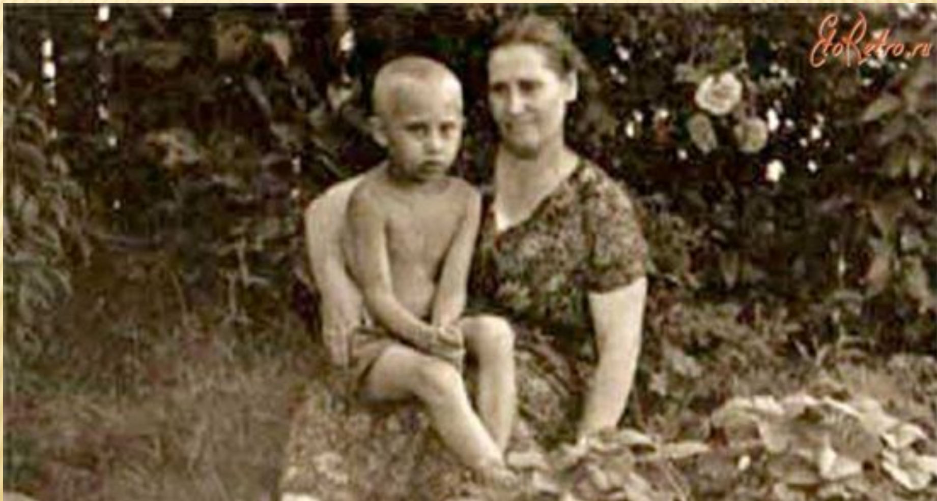
Вова с мамой Марией Ивановной, здесь ему 5 лет.

Владимир Путин, родился в Ленинграде 7 октября 1952 года в рабочей семье.