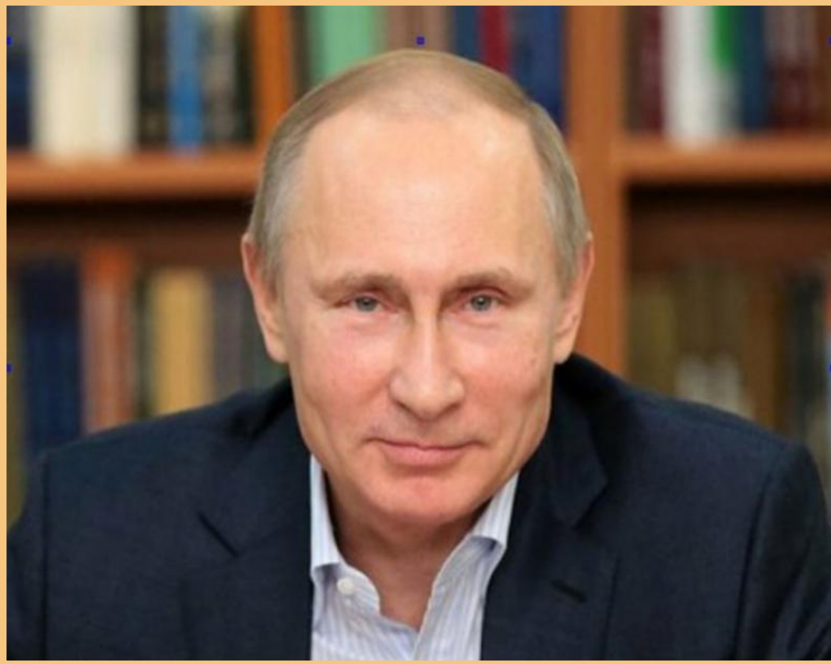
ПРЕЗИДЕНТ РОССИИ ВЛАДИМИР ВЛАДИМИРОВИЧ ПУТИН