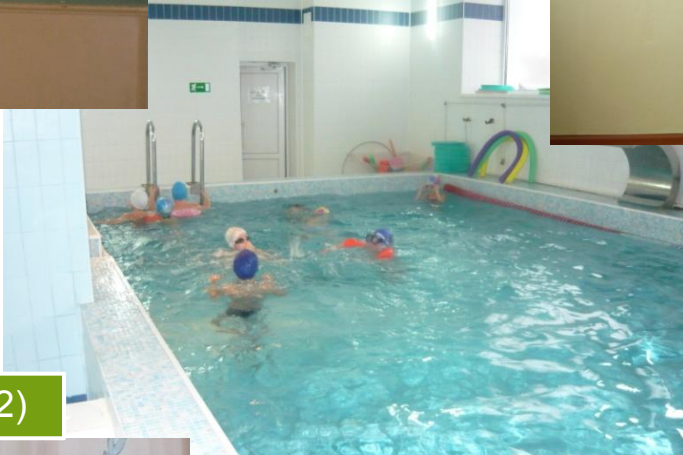
Занятия в бассейне