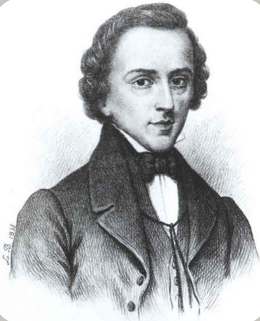
Фридерик Шопен (1810-1849)