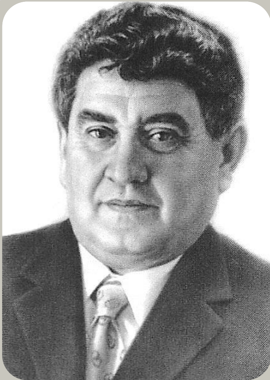
ДРАГУНСКИЙ ВИКТОР ЮЗЕФОВИЧ (1913-1972)