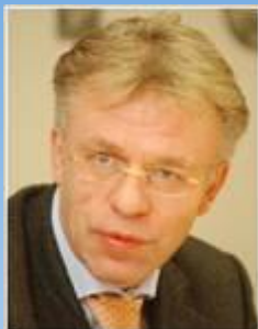
Фетисов Вячеслав Руководитель Федерального агент- ства по физической культуре и спорту