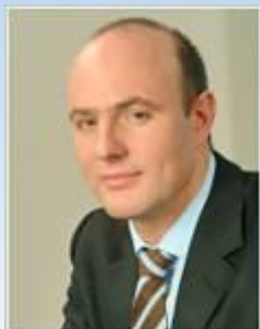
Чернышенко Дмитрий Генеральный директор