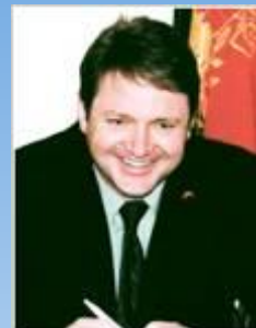
Ткачев Александр Губернатор Краснодарского края