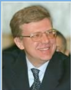
Кудрин Алексей Заместитель председателя