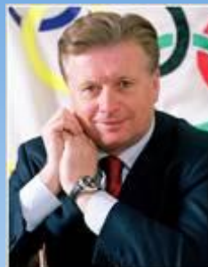
Тягачев Леонид Президент Олимпийского комитета России