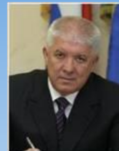
Колодяжный Виктор Глава города Сочи