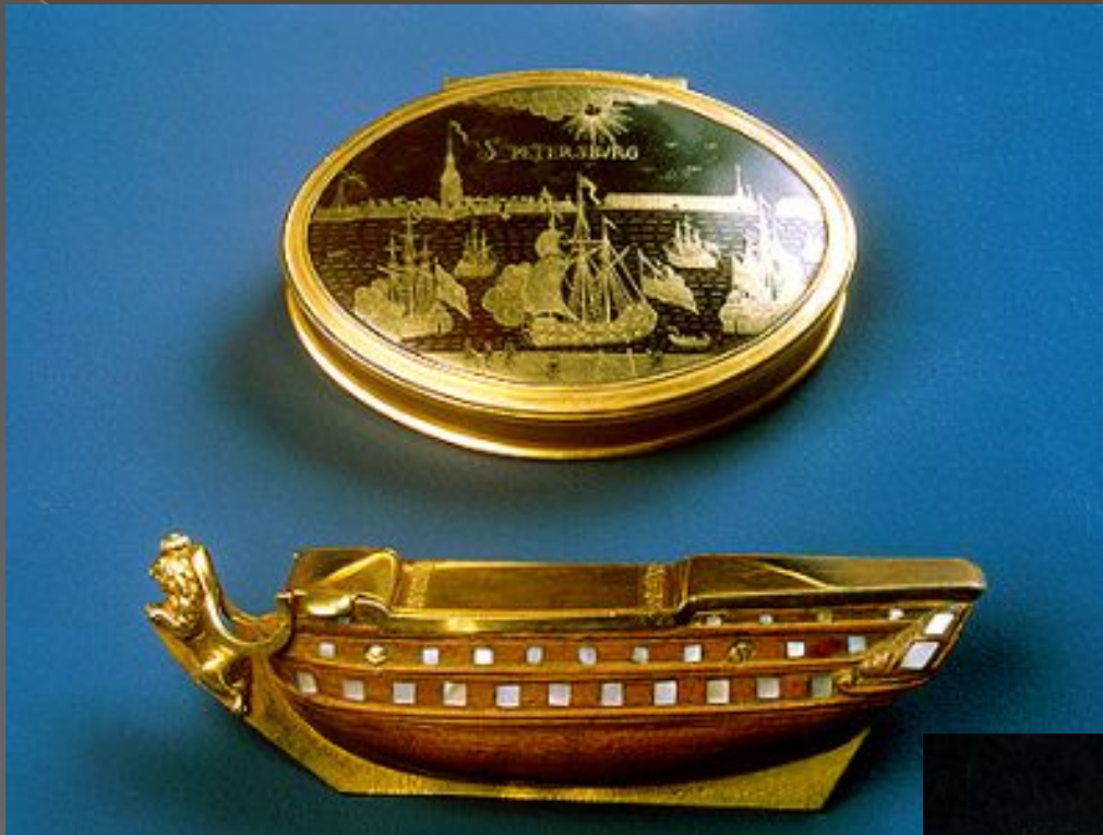
Табакерка 3.2x2.9x12.2 см Россия. 17 век.