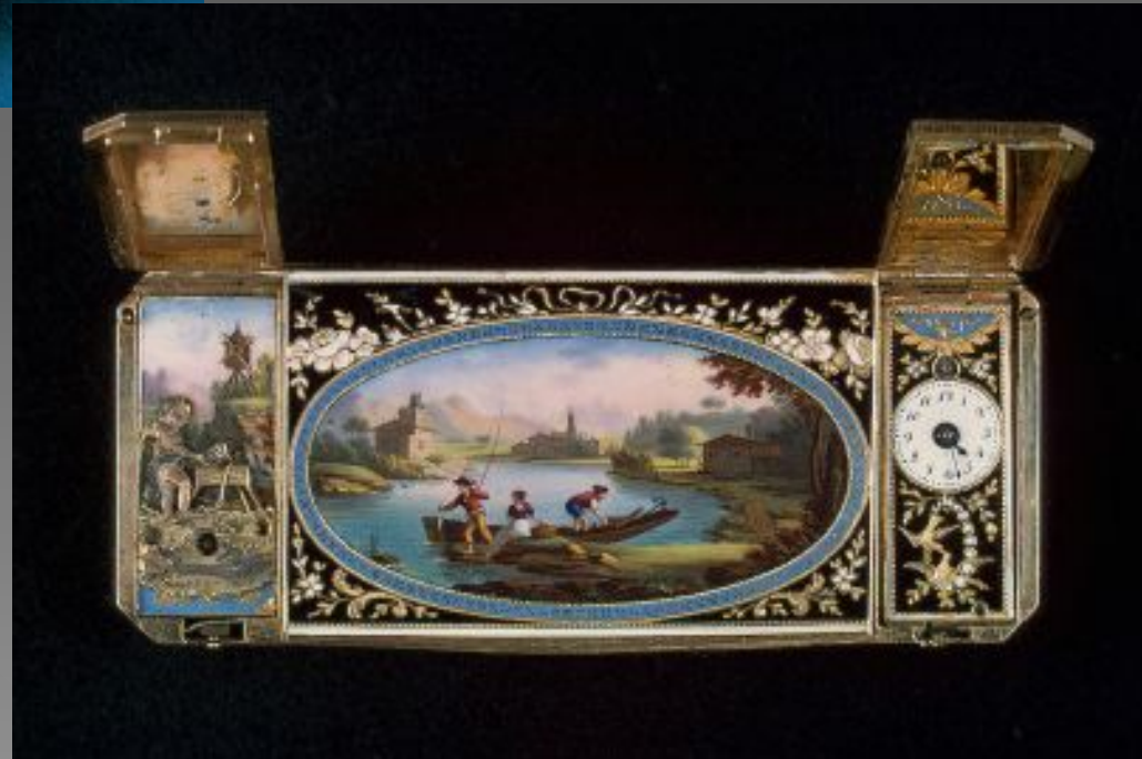
Табакерка с часами Женева. 1790 г.