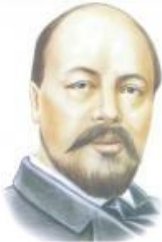
ЛЯДОВ Анатолий Константинович (1855-1914)