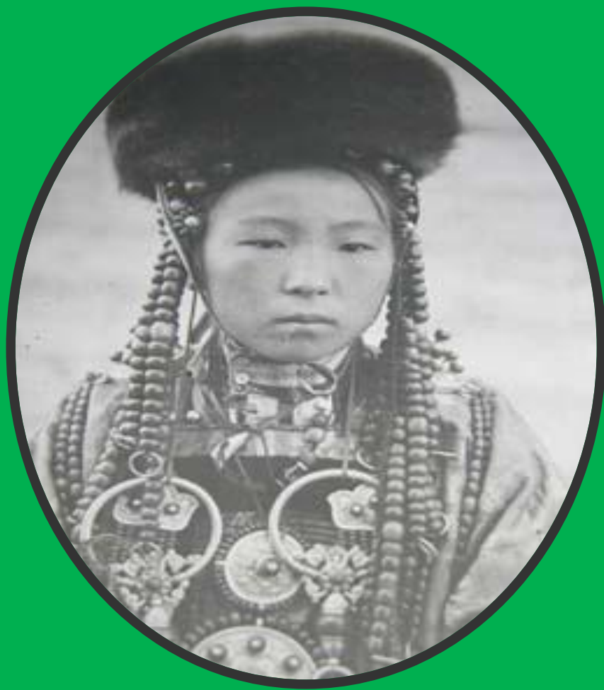
Девушка - бурятка в праздничной одежде. Фото начала XX в.

Буряты, бурят, буряад (самоназв.), этнос в Забайкалье, коренное население Агинского Бурятского автономного округа Читинской области. Живут также в некоторых других районах Читинской области. Численность в Агинском автономном округе около 42,4 тыс. Говорят на бурятском языке монгольской группы алтайской семьи. Распространен также русский язык. До 1930 года пользовались старомонгольской письменностью, с 1931 - письменностью на основе латинской графики, с 1939 - на основе русской графики. Верующие буряты Восточного Забайкалья - буддисты.