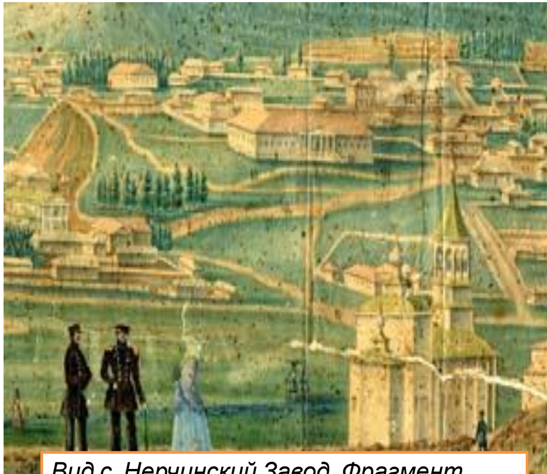
Вид с. Нерчинский Завод. Фрагмент акварели XIX в.