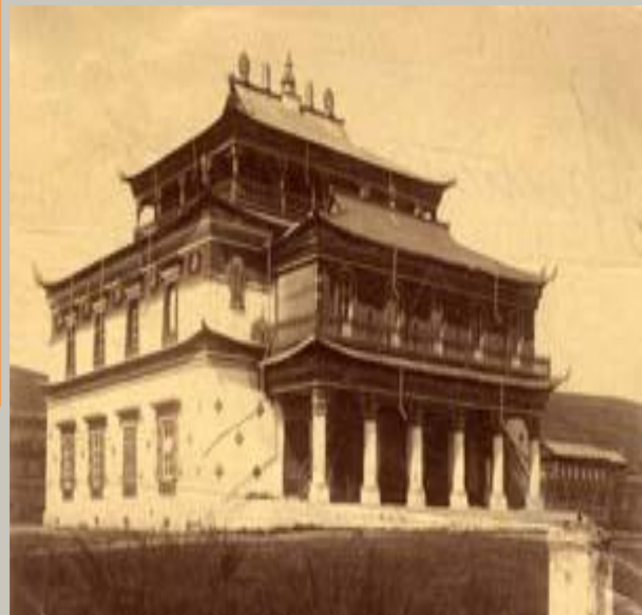
Фото начала XX в.