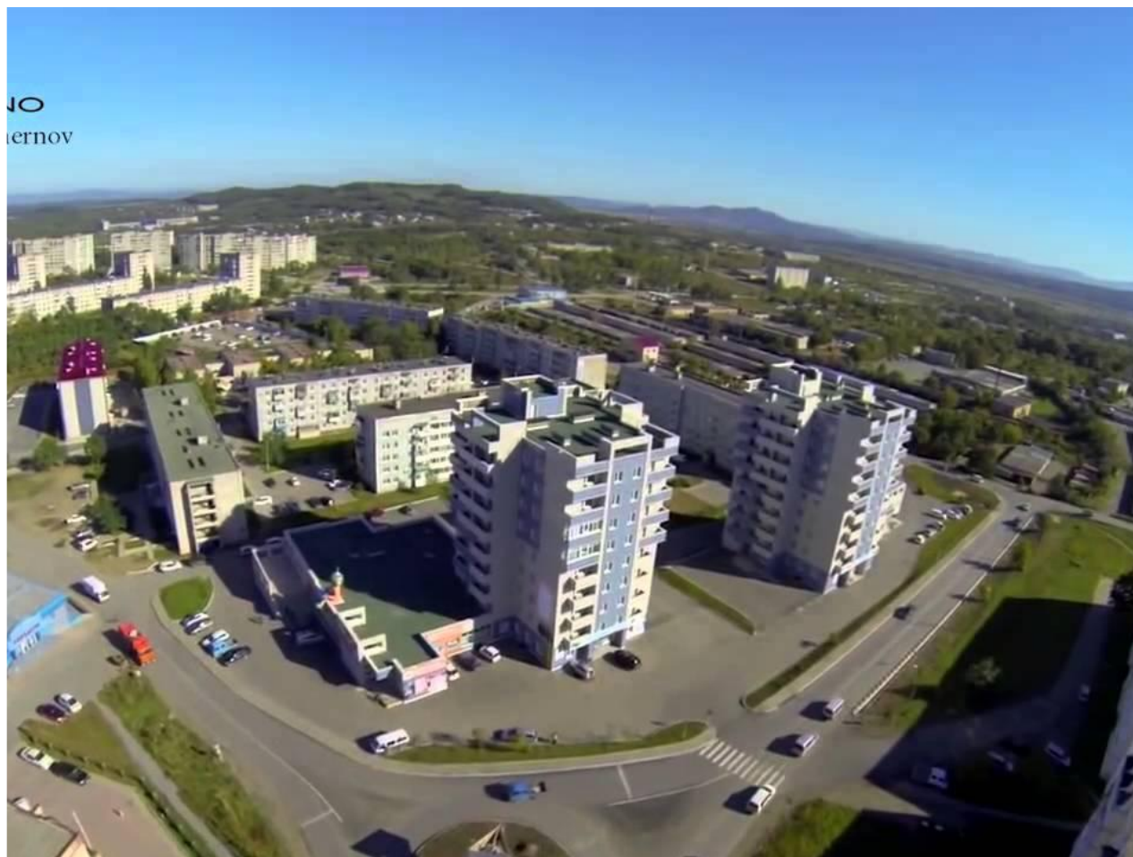
Новые девятиэтажные дома по улице Гагарина