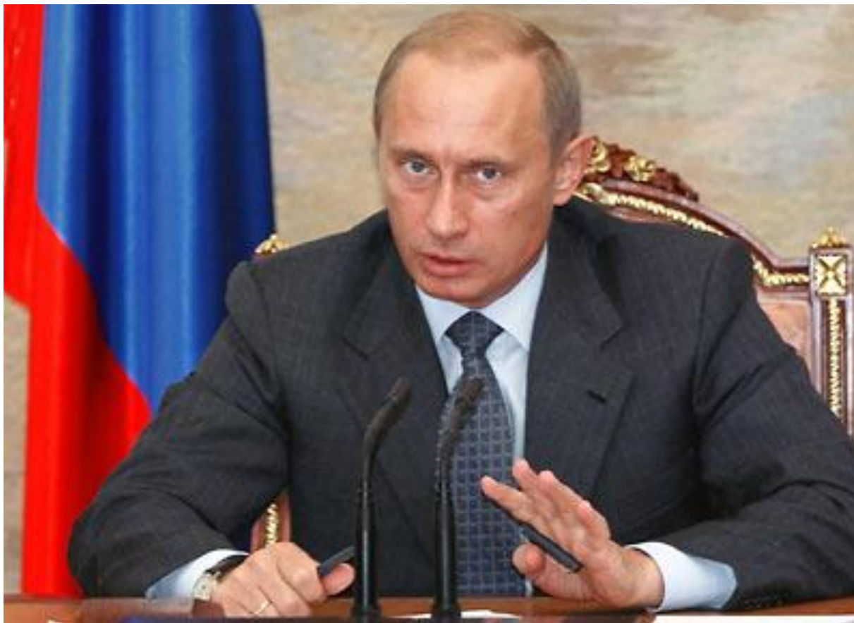
Владимир Владимирович Путин