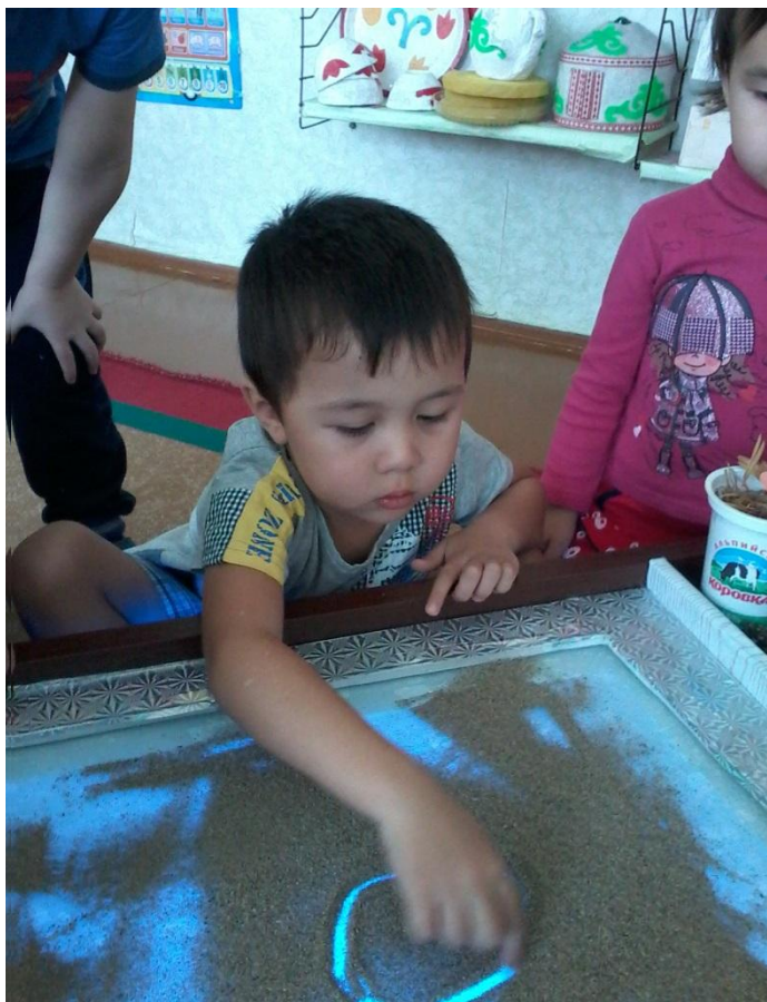
Рисунок для ребенка является не искусством, а речью.