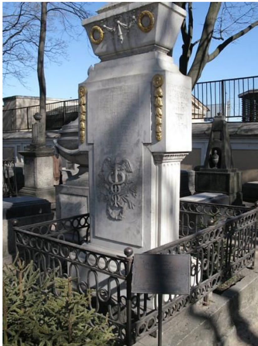
Могила М.В. Ломоносова в Александро-Невской Лавре в Санкт-Петербурге