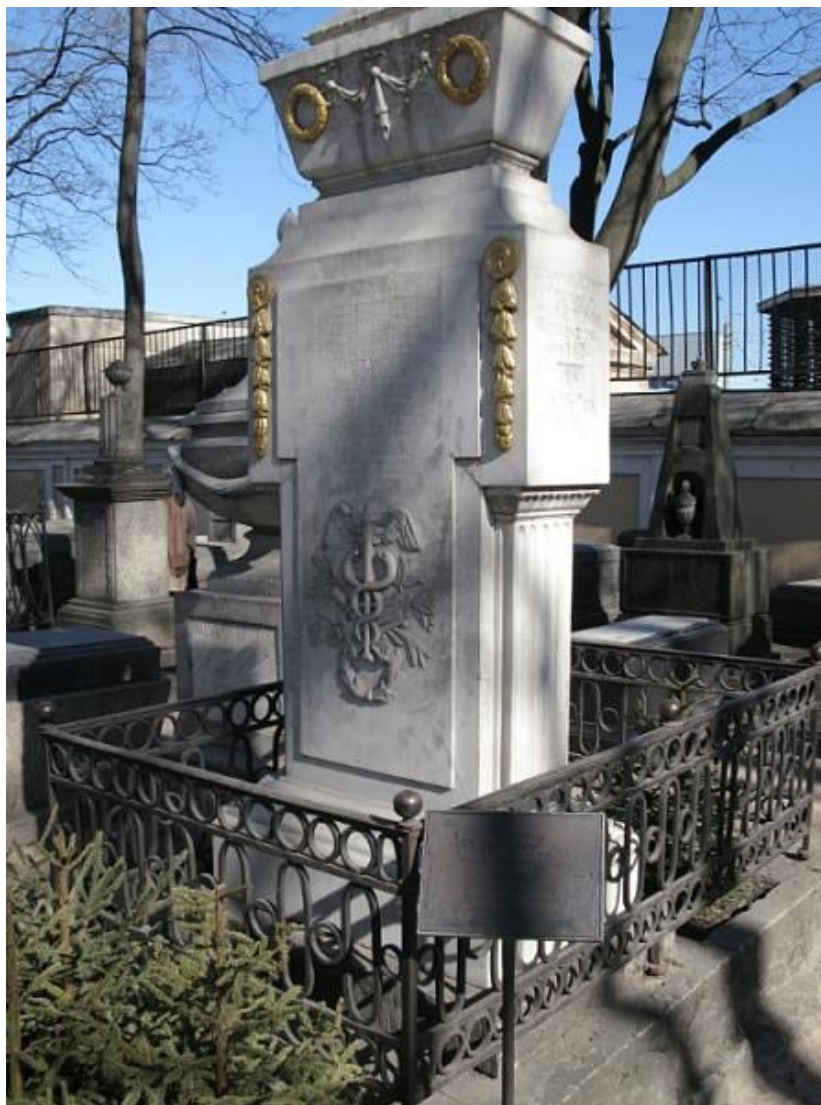
Могила М.В. Ломоносова в Александро-Невской Лавре в Санкт-Петербурге