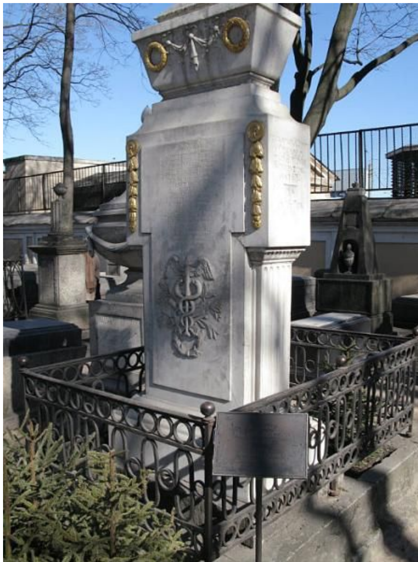
Могила М.В. Ломоносова в Александро-Невской Лавре в Санкт-Петербурге