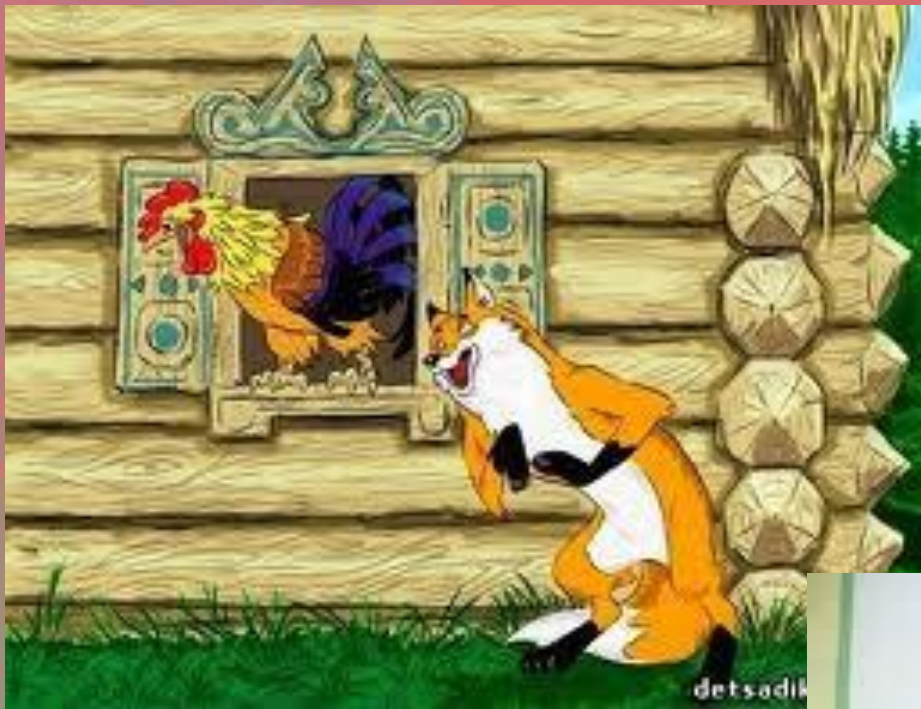
«Кот, петух и лиса»