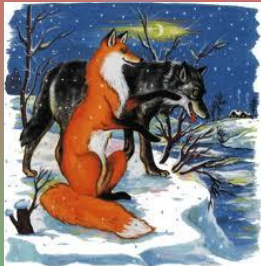
«Волк и лиса»