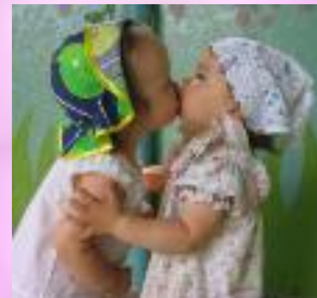
Так здороваются с родственниками