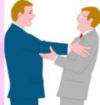
Так приветствуют друг друга приятели