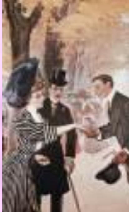
Так мужчина приветствует даму