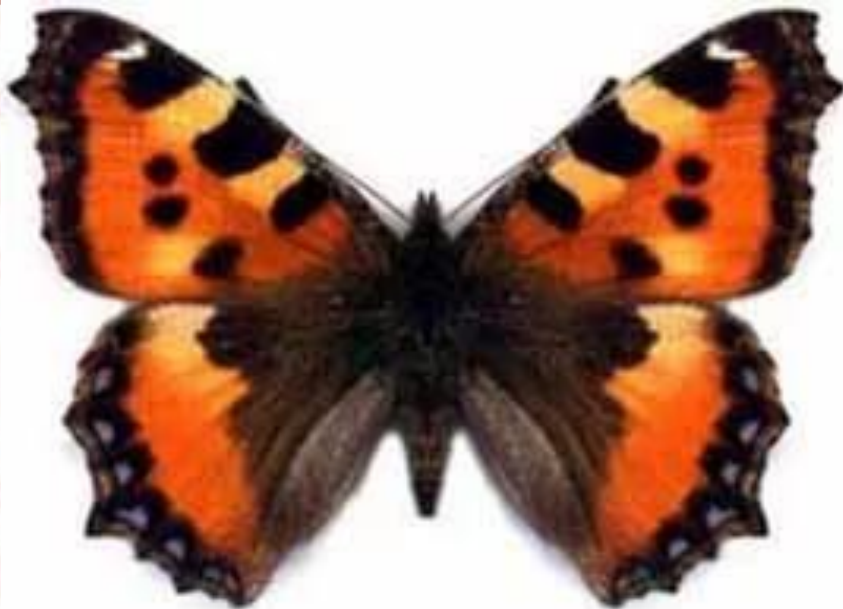
бабочка Ванесса Карди семейства Нимфалиды