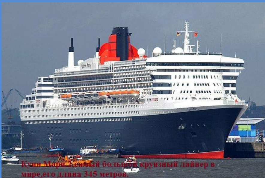
Крупный итальянский большой круизный лайнер в мире, его длина 345 метров.