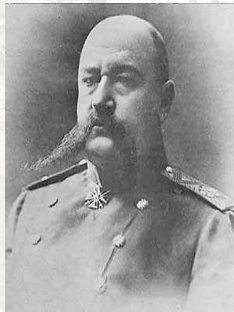
Николай Николаевич Юденич