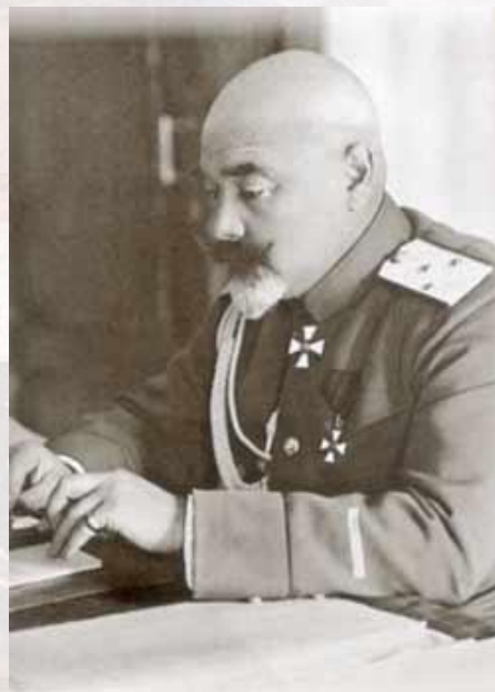
Антон Иванович Деникин