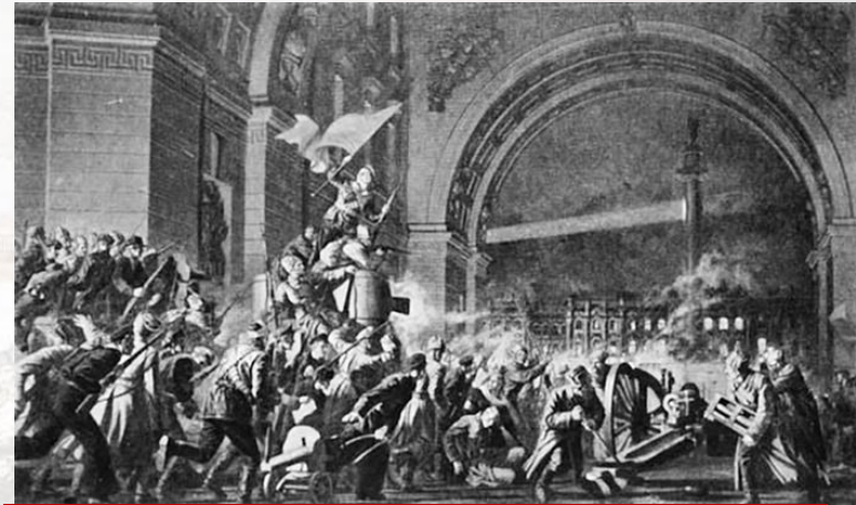
Октябрьская революция 1917 года