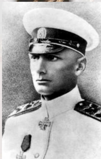
Александр Васильевич Колчак