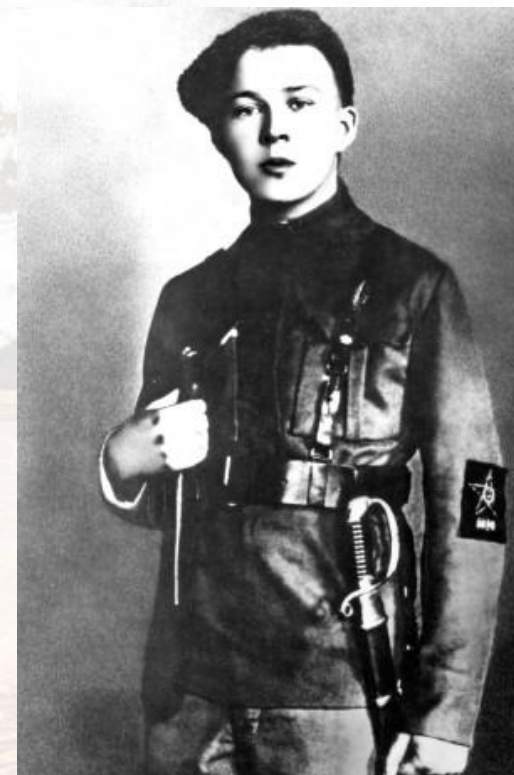
Аркадий Голиков (Гайдар)