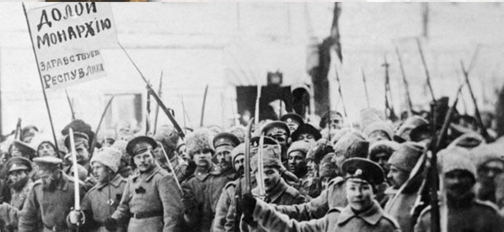
Февральская революция 1917 года