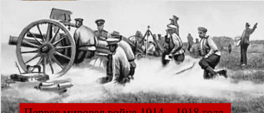
Первая мировая война 1914 – 1918 года