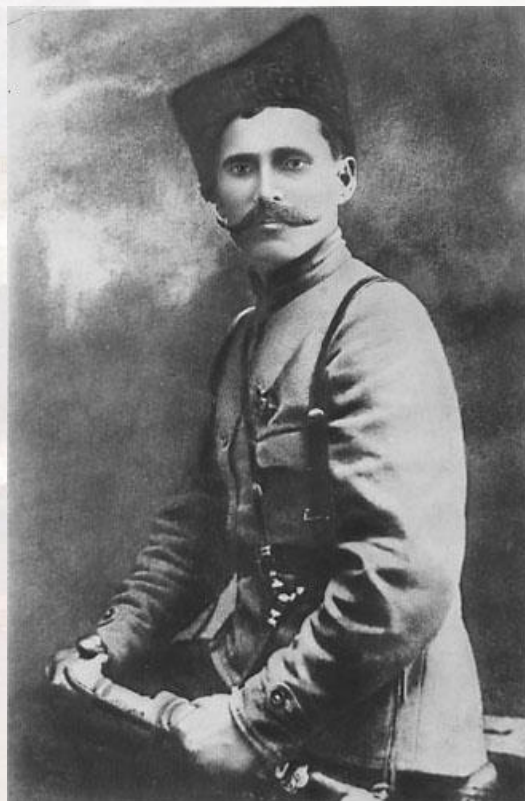
Василий Иванович Чапаев