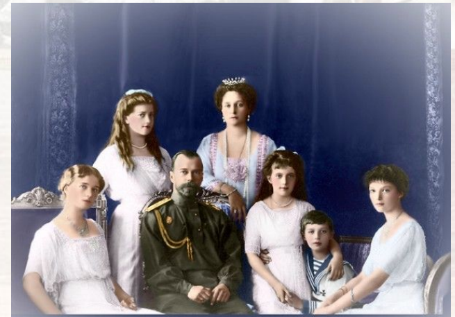
1918 год – расстрел царской семьи