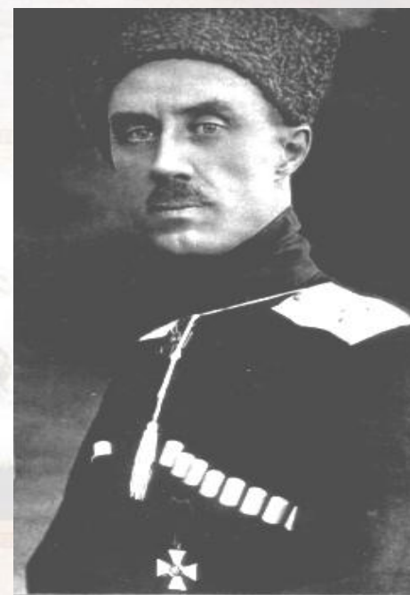
Петр Николаевич Врангель