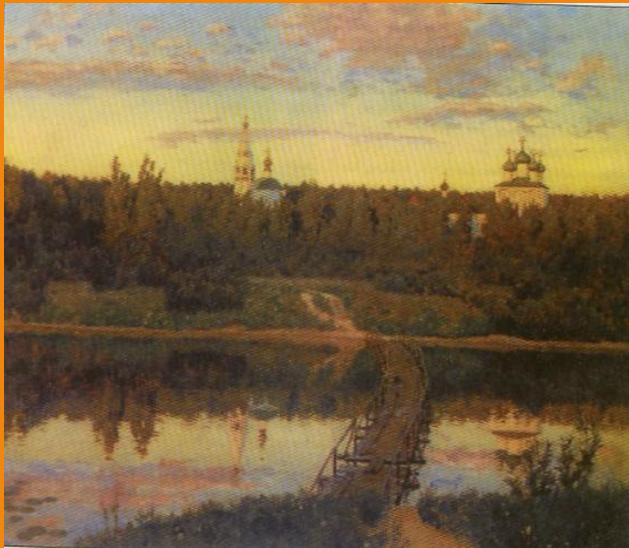
Исаак Левитан Тихая обитель