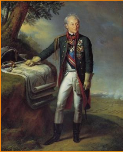
А. В. Суворов