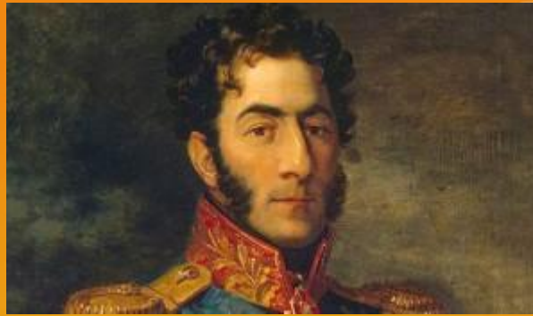
П. И. Багратион