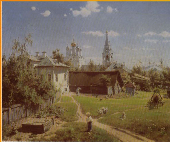
Поленов В.Д. Московский дворик