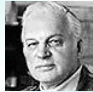
Станислав Иосифович Росточкий - режиссёр фильма «Белый Бим Чёрное ухо»