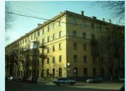
Дом в Воронеже, в котором жил писатель.