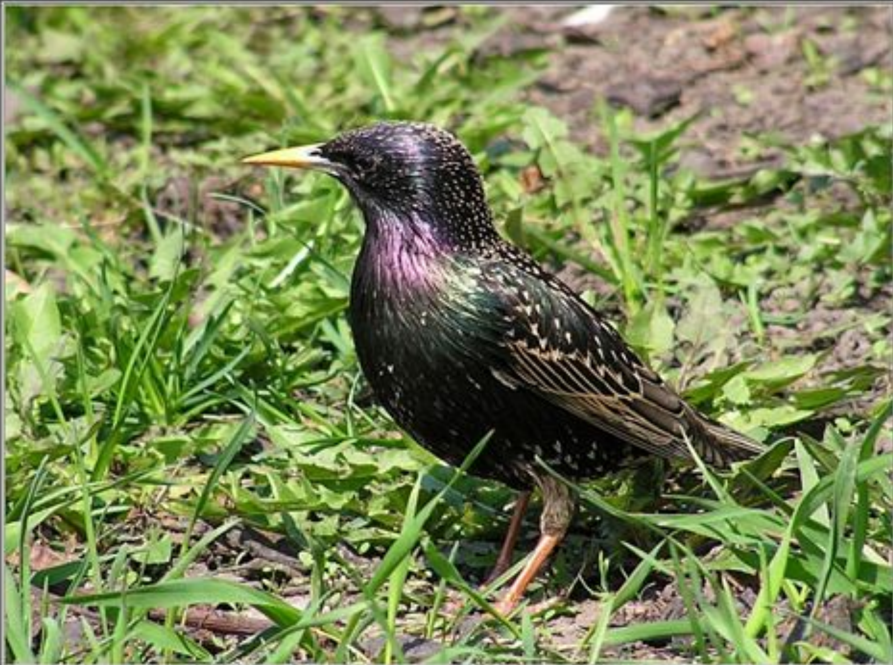
Скворец обыкновенный (Sturnus vulgaris)