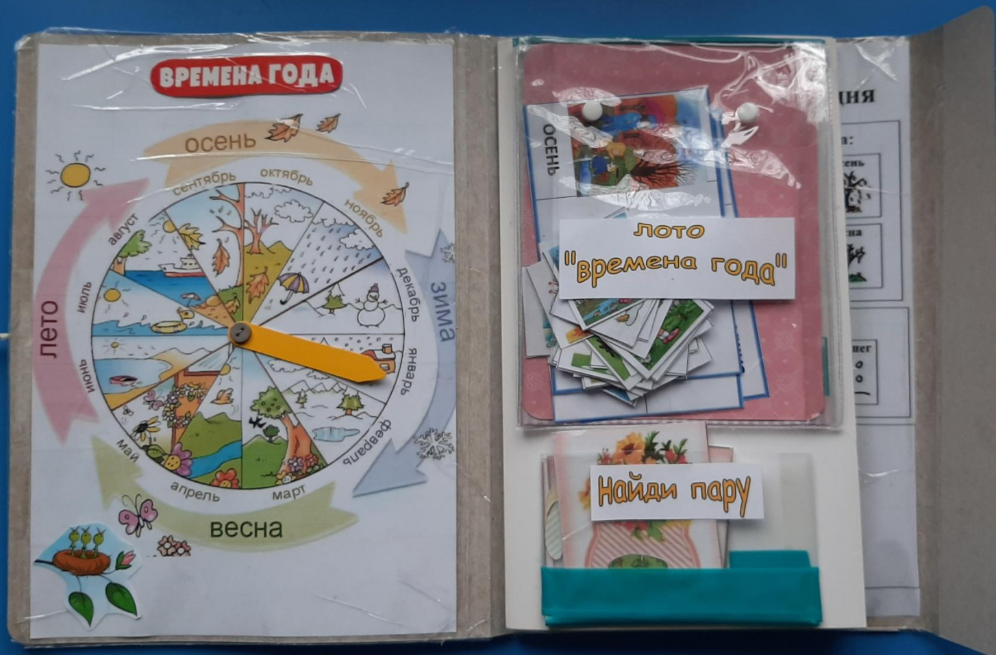
Дидактическая игра Круг "Времена года"