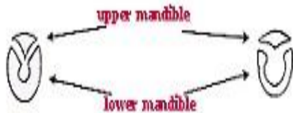
mandible in cross section