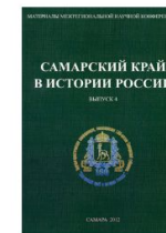
САМАРСКИЙ КРАЙ В ИСТОРИИ РОССИИ. САМАРА, 2012