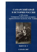
САМАРСКИЙ КРАЙ В ИСТОРИИ РОССИИ. ВЫПУСК 3. САМАРА, 2007