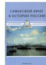
САМАРСКИЙ КРАЙ В ИСТОРИИ РОССИИ. САМАРА, 2001