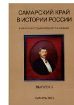
САМАРСКИЙ КРАЙ В ИСТОРИИ РОССИИ. ВЫПУСК 2: К 180-ЛЕТИЮ СО ДНЯ РОЖДЕНИЯ П.В.АЛАБИНА. САМАРА, 2004