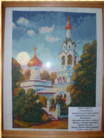
МОУСОШ № 1 г. Новокубиска муниципальный район Новокубиский район Панаевская «Византизм искусство, святое Милосердие, святое искусство» «Уроки Религии» Бакули Роман Викторович 9 лет, 2 года жизни