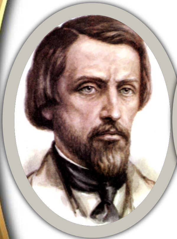
Белинский В.Г. (1811-1848)