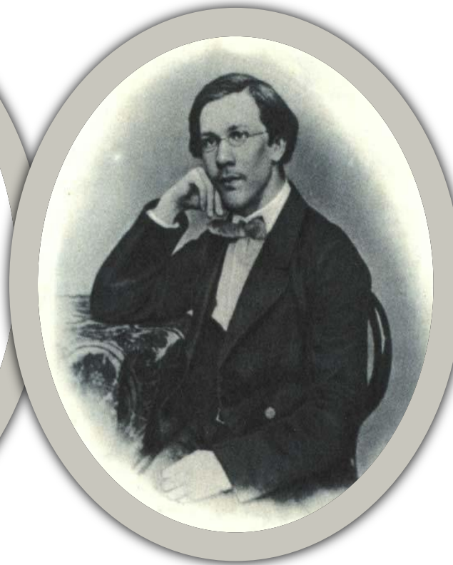
Добролюбов Н.А. (1836-1861)