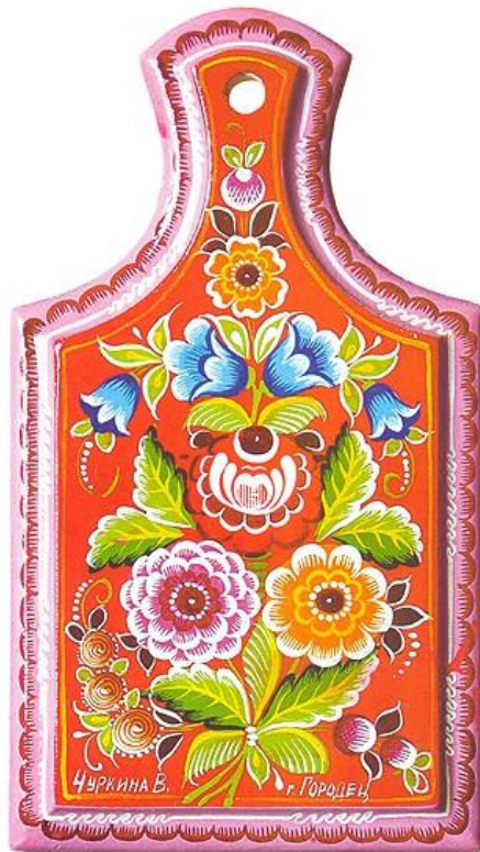
ДОСКА «ГОРОДЕЦКИЕ ЦВЕТЫ»