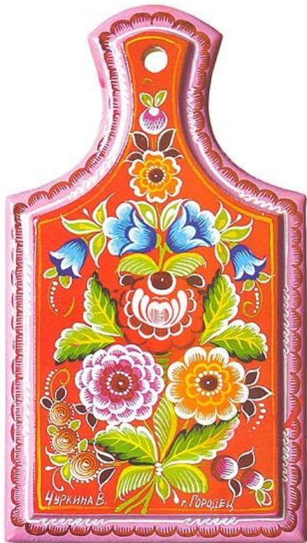
ДОСКА «ГОРОДЕЦКИЕ ЦВЕТЫ»