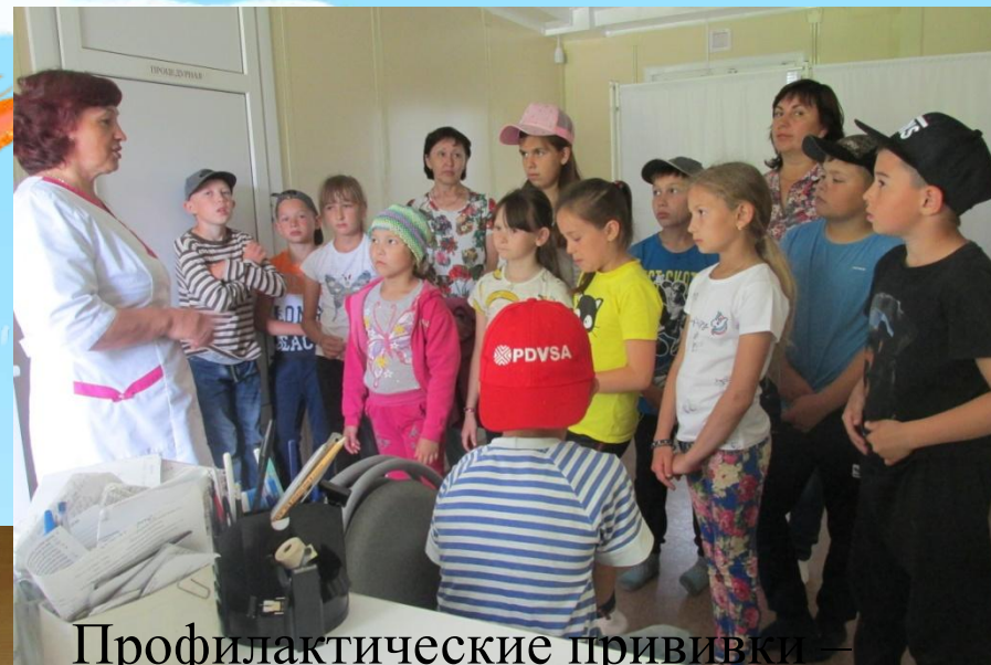
Профилактические прививки — «За» или «Против». «Чем опасны клещи?»