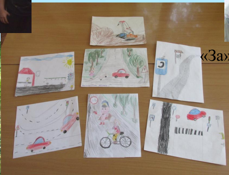
Соблюдайте правила дорожного движения!