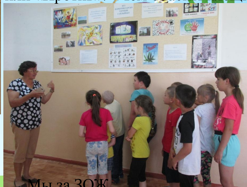
Мы за ЗОЖ