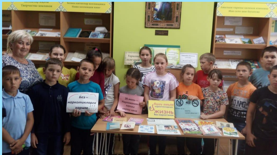
ЖИЗНЬ БЕЗ НАРКОТИКОВ