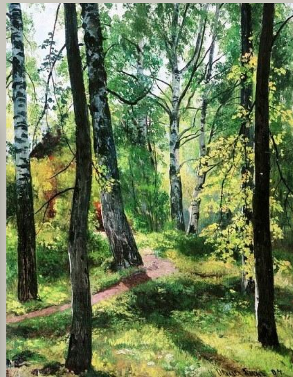
И. Шишкин «Лиственный лес»