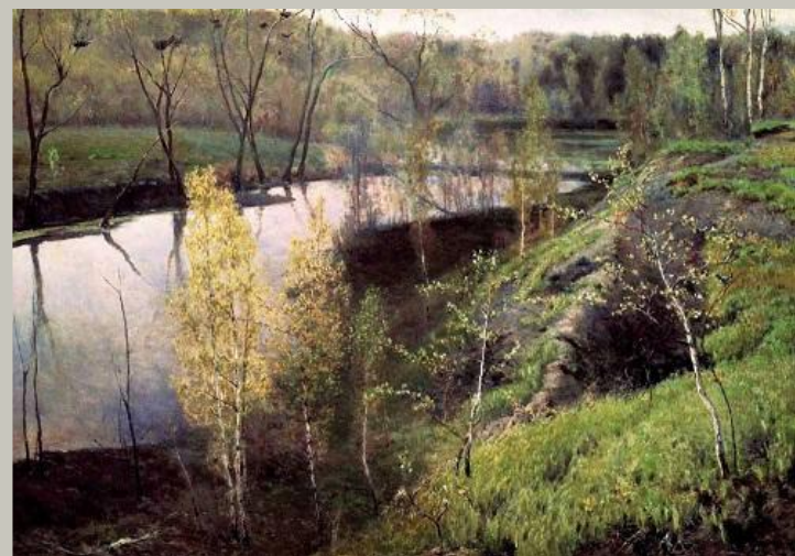
И. Остроухов «Первая зелень»