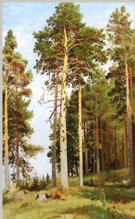
И. Шишкин «Сосны, освещенные солнцем»