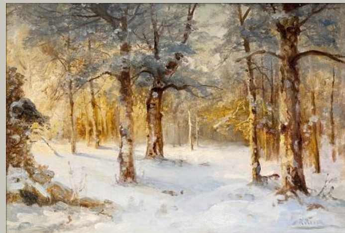
К. Розен «Ясный зимний день в лесу»