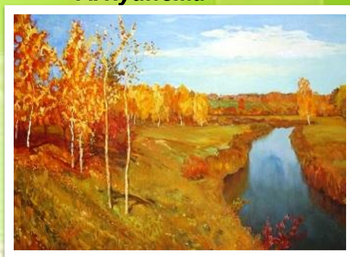
И. Левитан «Золотая осень»