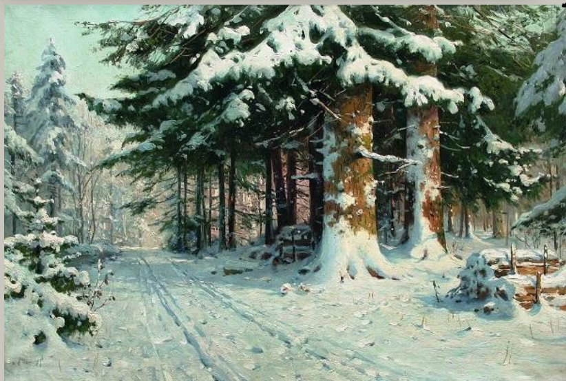
А. Шильдер «Зимний лес»