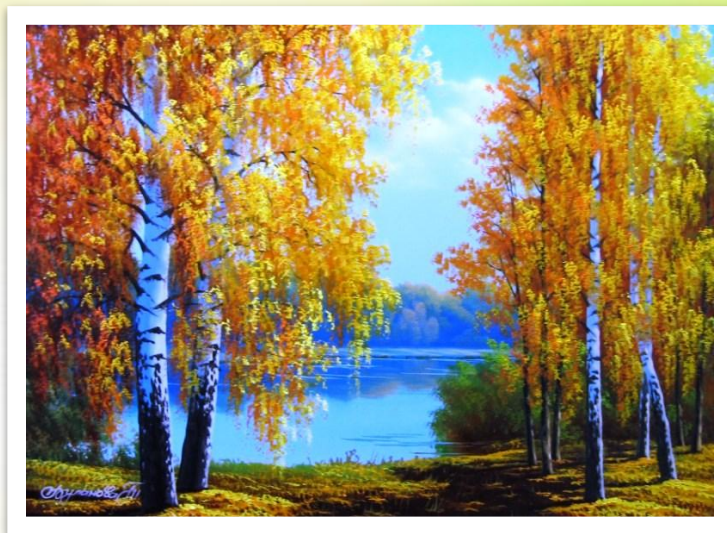
В. Светашов «Осенний этюд»