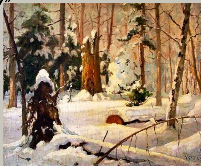
К. Крыжицкий «В лесу»