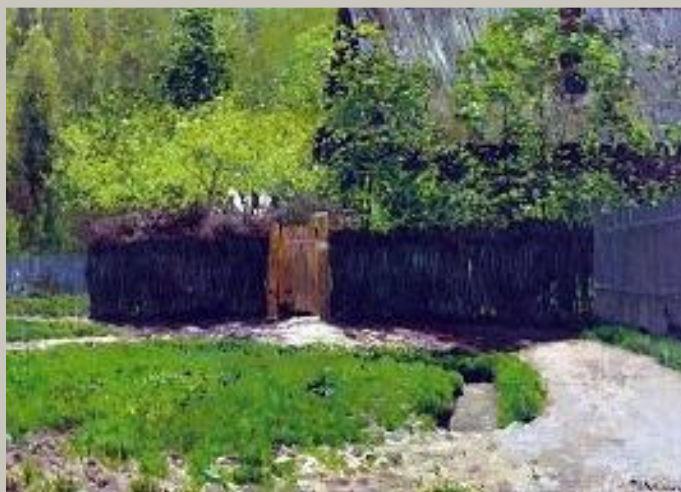
И. Левитан «Весна. Последний снег»