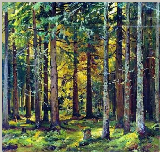
И. Шишкин «Еловый лес»