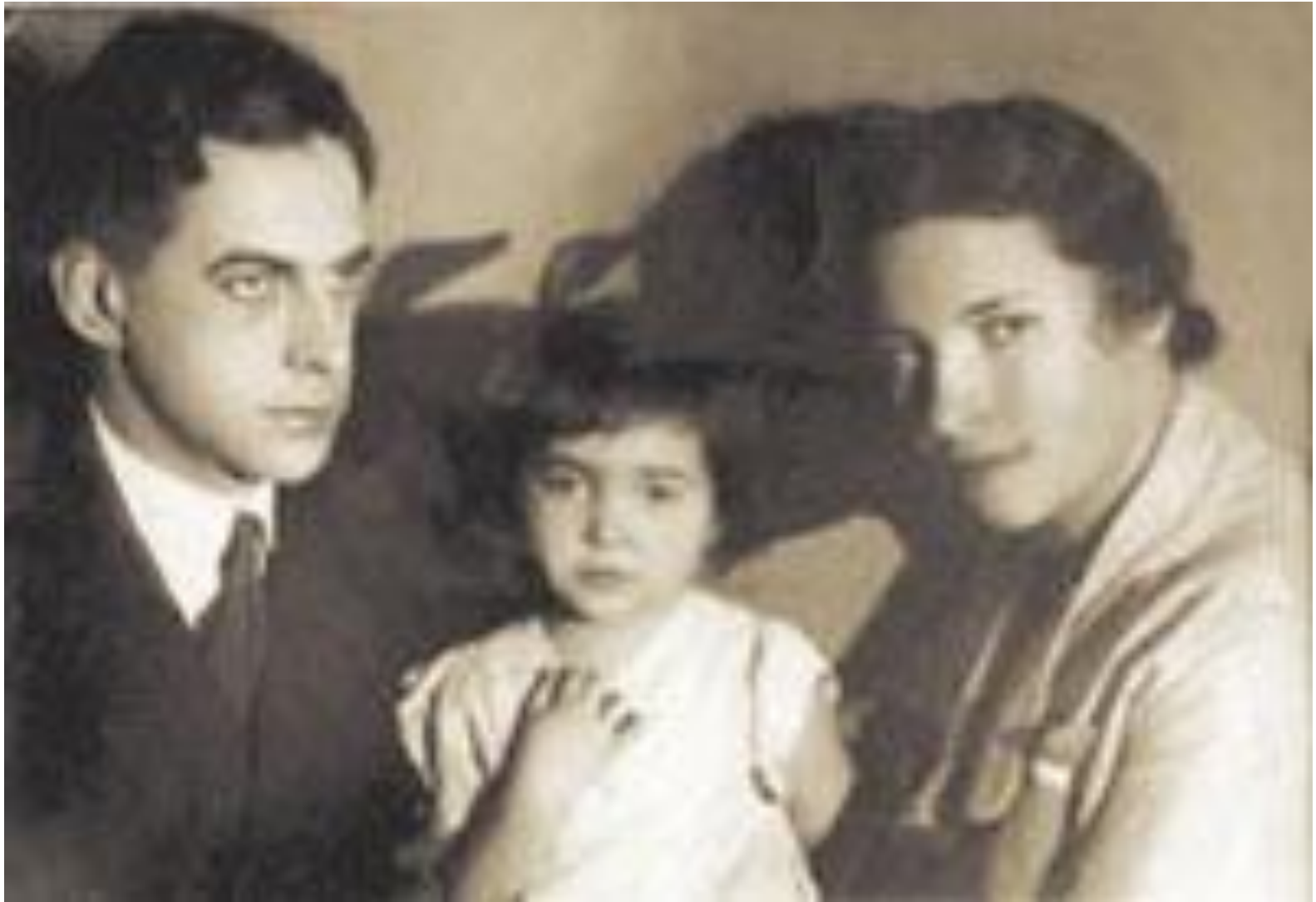
Маленькая Агния Барто с родителями