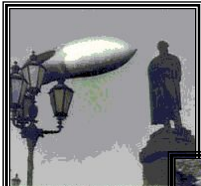
Видеоархив российской истории