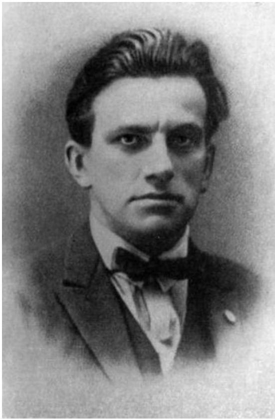
Маяковский Владимир Владимирович