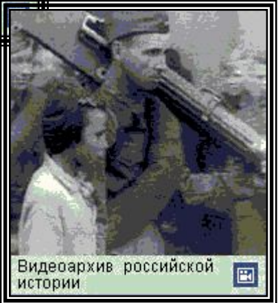
Видеоархив российской истории

Во время Великой Отечественной войны А.Барто выезжала на фронт с чтением своих стихов, выступала по радио, писала для газет.