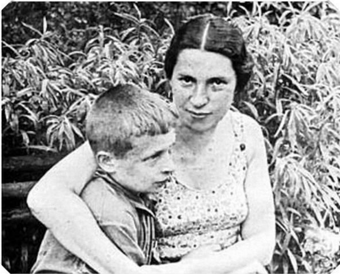
Агния Барто с сыном