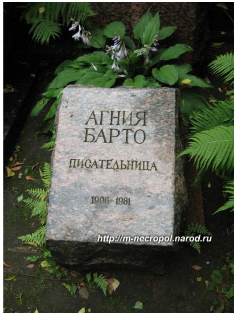
Могила Агнии Барто на Новодевичьем кладбище в Москве.