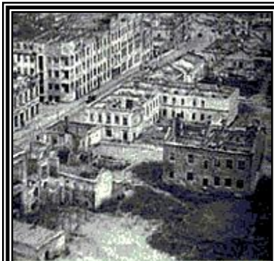
Видеоархив российской истории