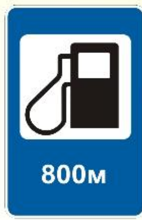
Авто - заправочная станция