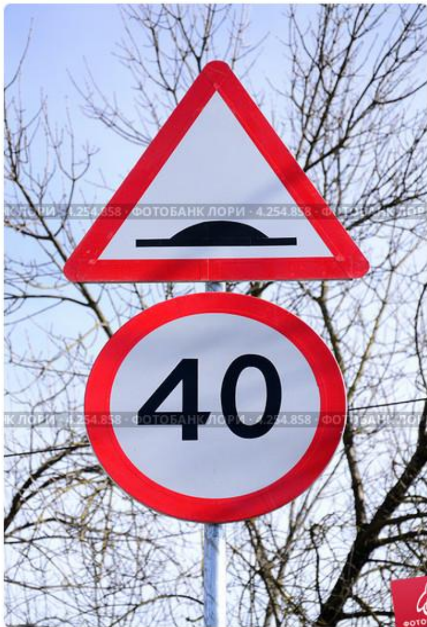
Дорожные знаки "Искусственная неровность" и "Ограничение скорости"