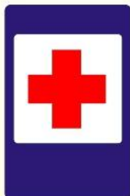
Пункт первой медицинской помощи