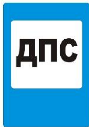
Пост дорожно - патрульной службы