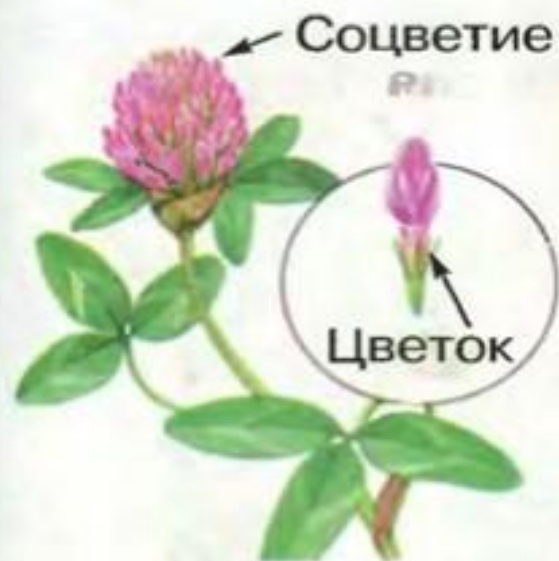
Соцветия разных растений