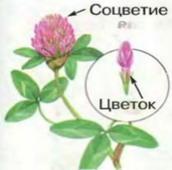
Соцветия разных растений