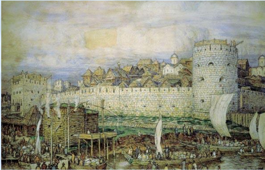
Московский Кремль при Дмитрие Донском. Художник А. Васнецов