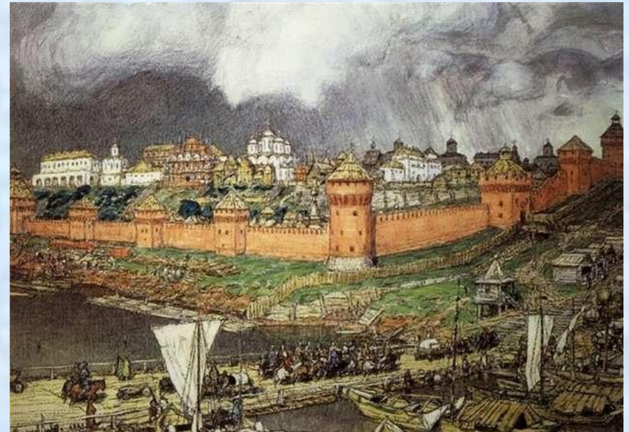
Московский Кремль при Иване III. Художник А. Васнецов