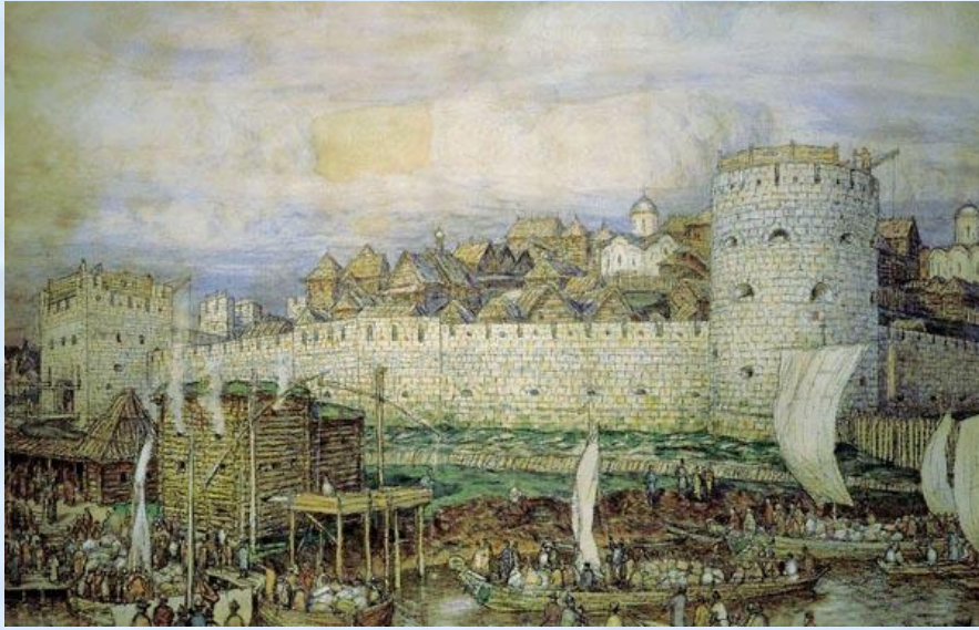
Московский Кремль при Дмитрие Донском. Художник А. Васнецов