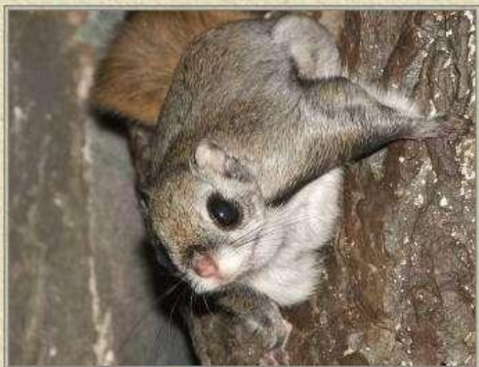
Белка – летяга