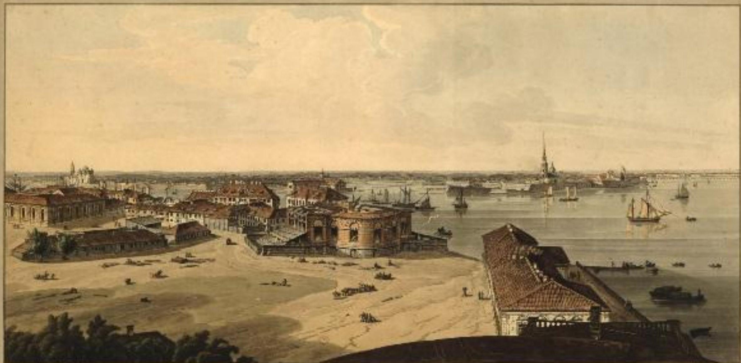
Городъ Рига, видъ отъ Спасскаго холма, 1790 г. Видъ на Ригу отъ Спасскаго холма, 1790 г. Видъ на Ригу отъ Спасскаго холма, 1790 г.