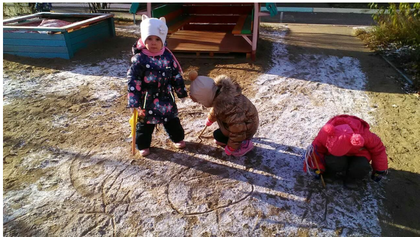
Опыт «Рисование на снегу»