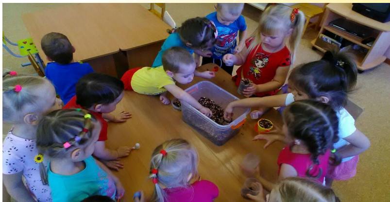
Опыт «Варим суп»