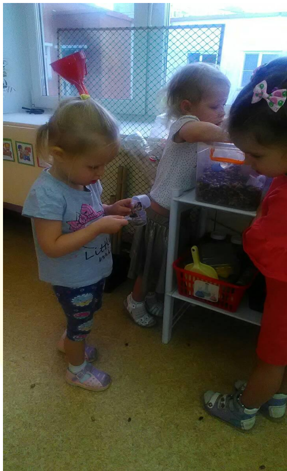
Опыт «Отгадай. что внутри?»