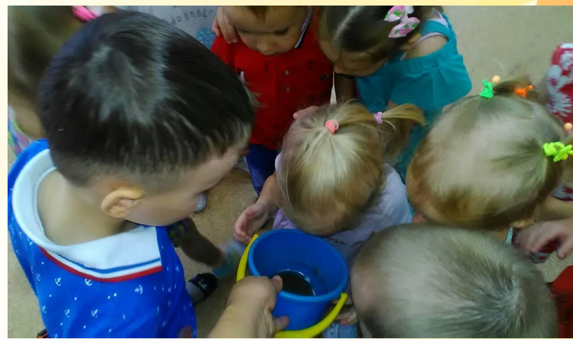
Опыт «Снег может таять»