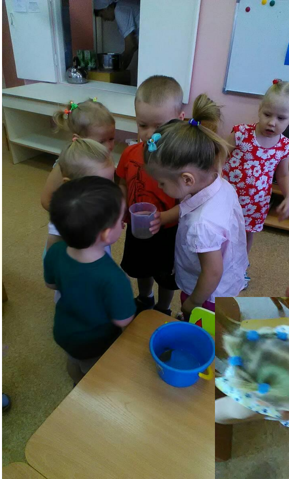
Опыт «Цветная вода»