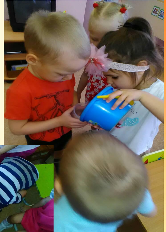
Опыт «Вода жидкая и текучая»