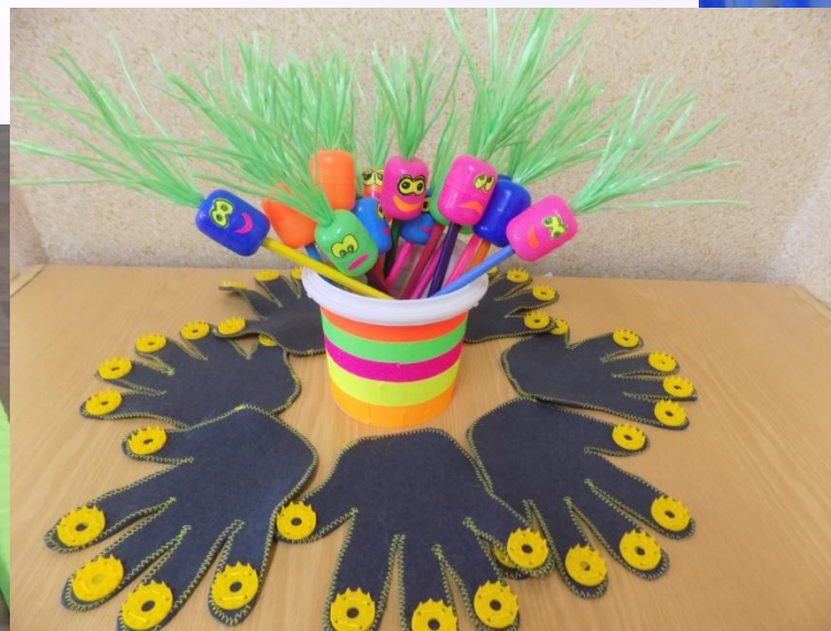
«Массажоры для ладошек»