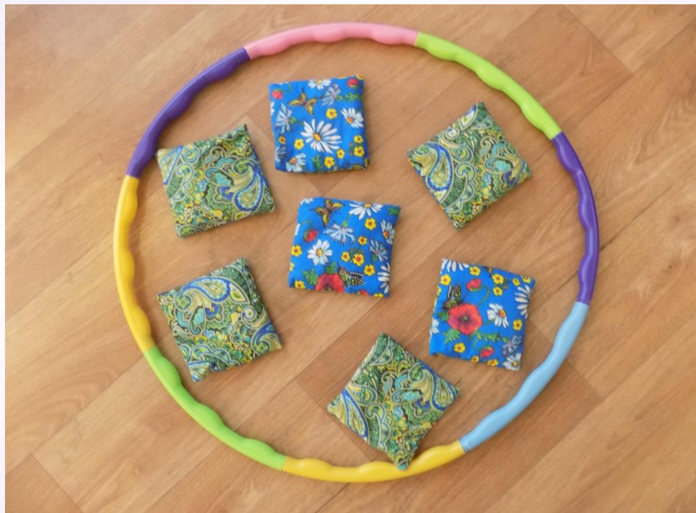
«Мешочки с зерном»