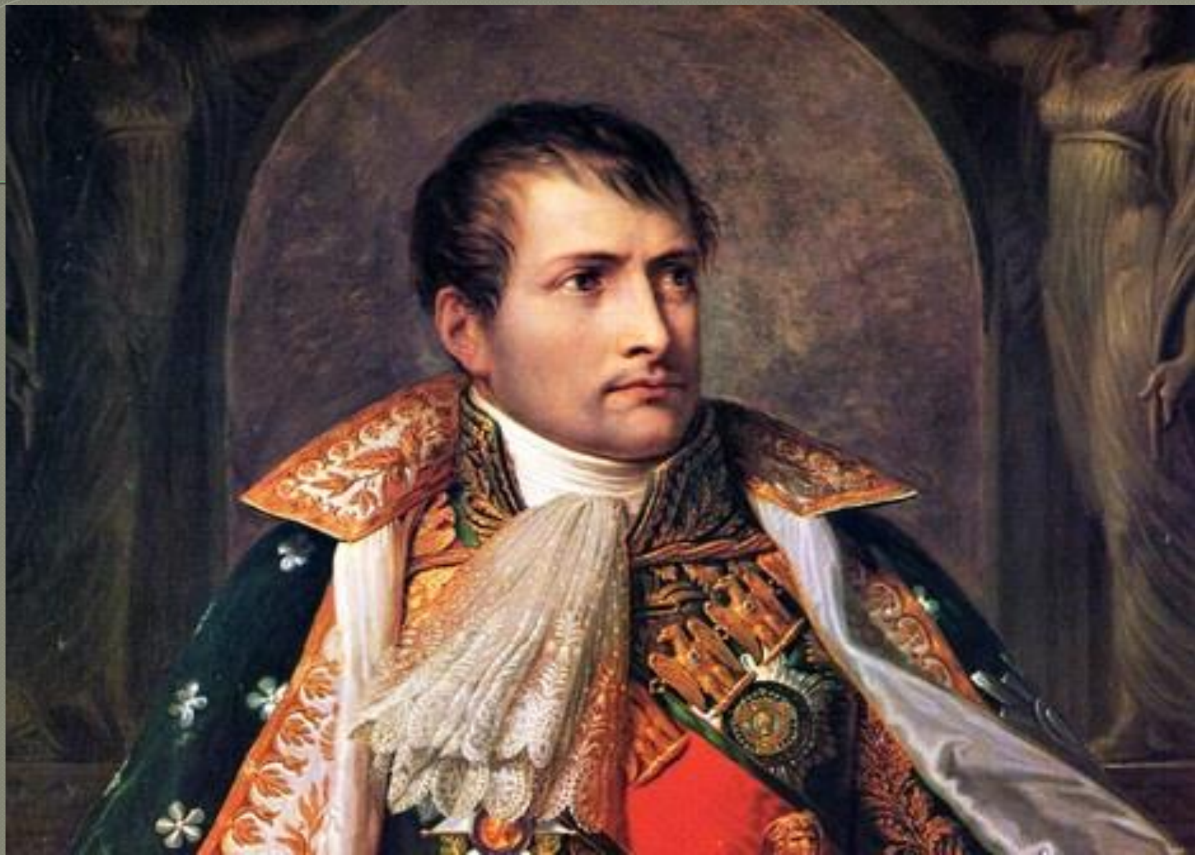
○ Наполеон Бонапарт