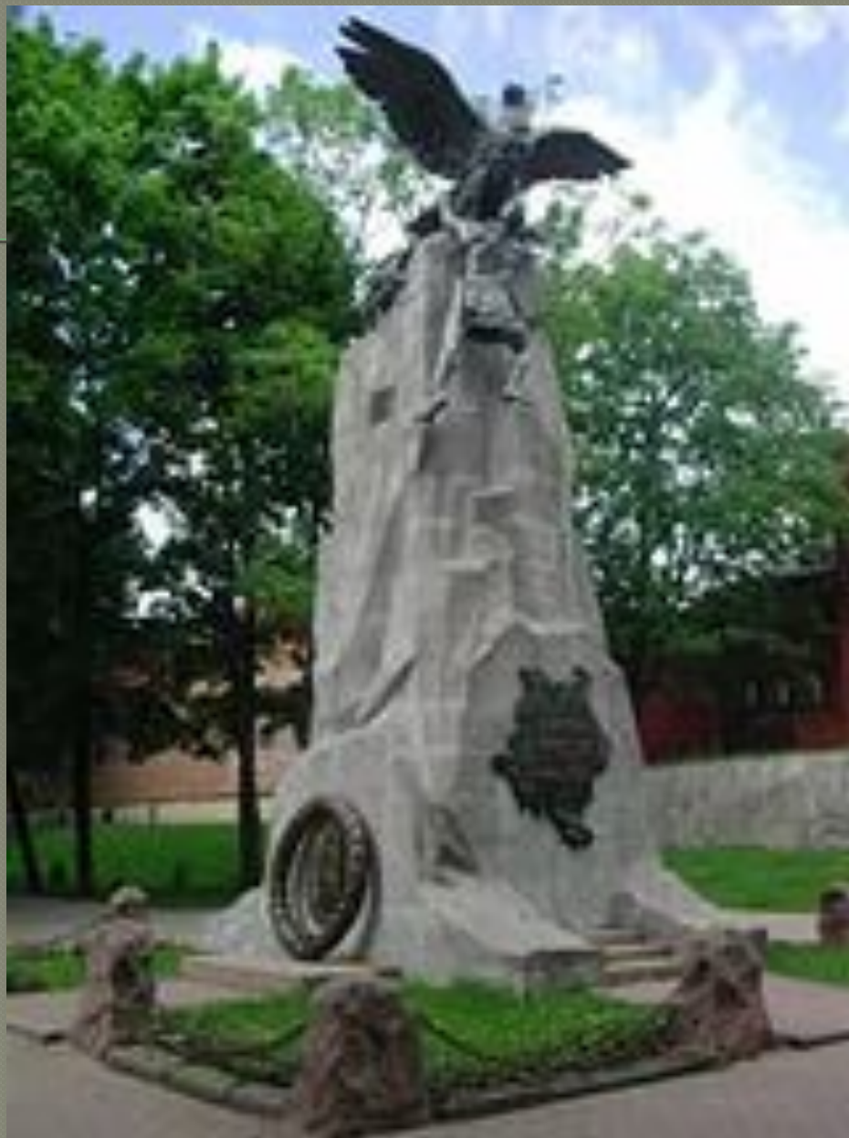
○ Памятник героям войны в Смоленске