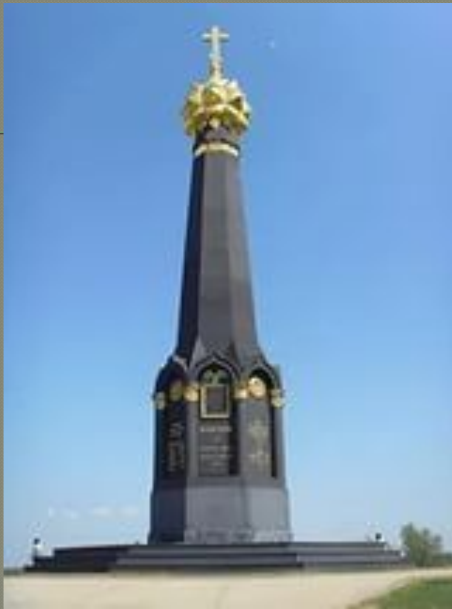
○ Памятная стела в Бородино