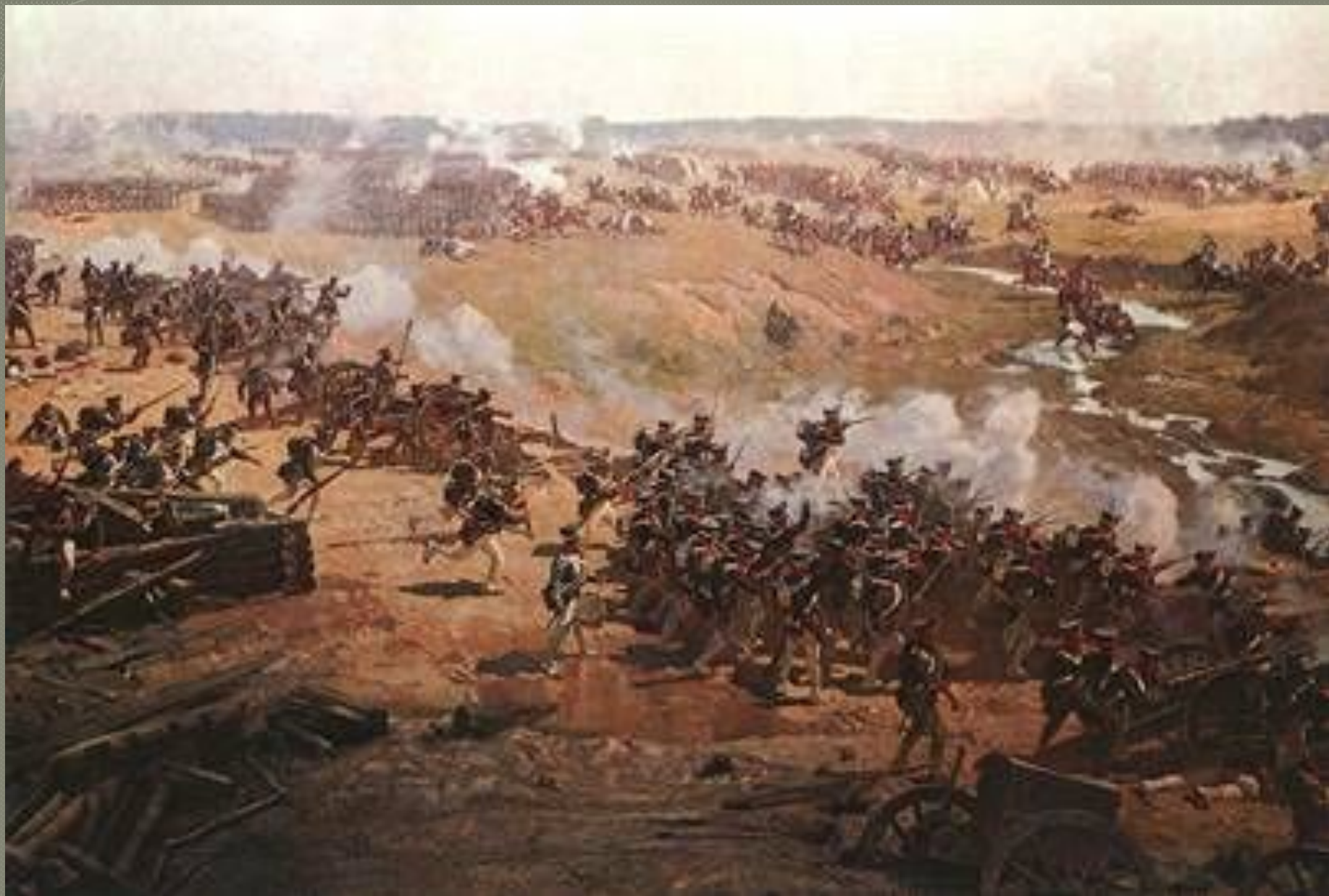
● Бородинская битва