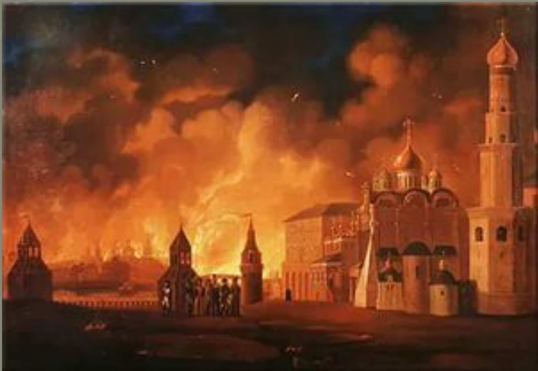
● Горящая Москва