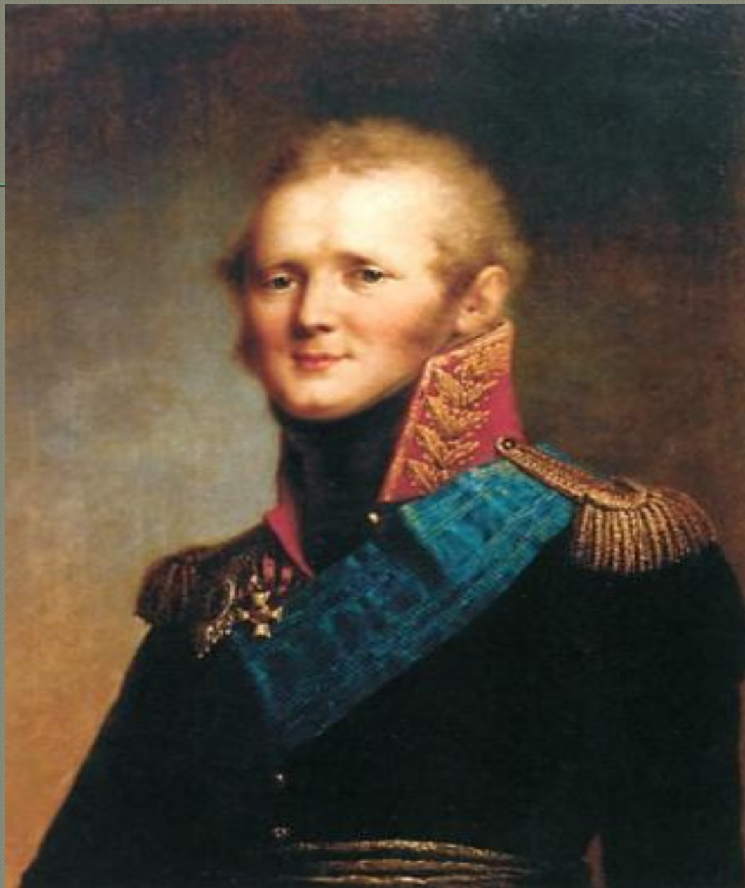
○ Александр I