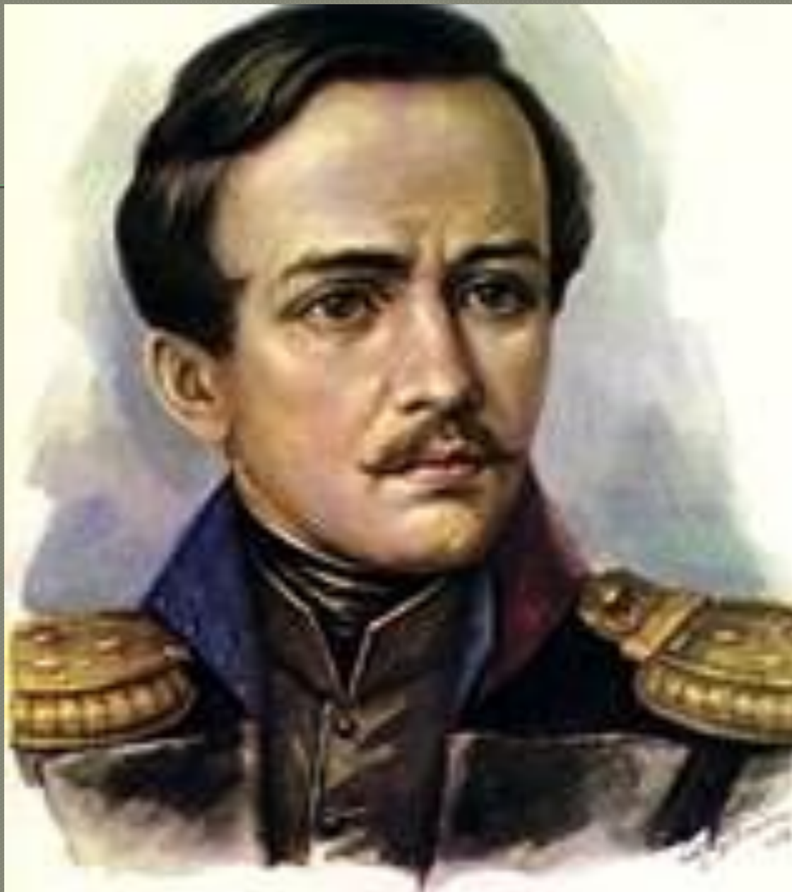
● М.Ю. Лермонтов