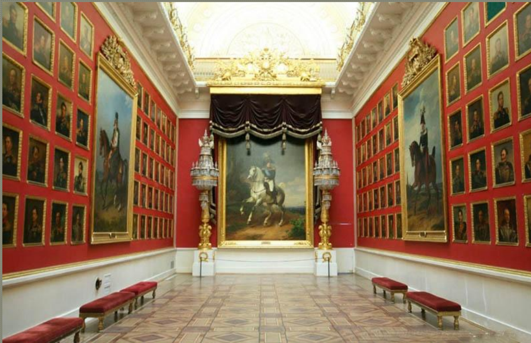
● Галерея воинской славы в Эрмитаже