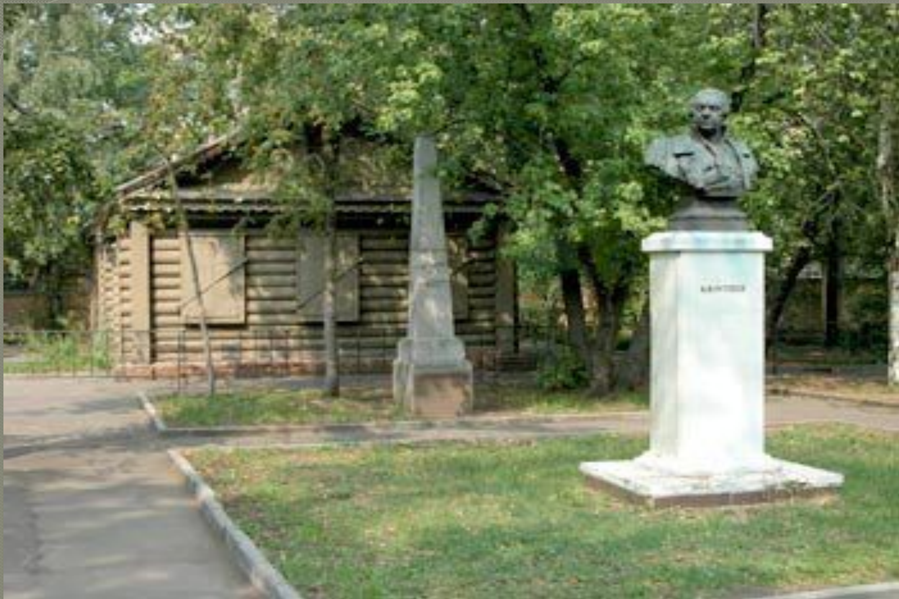
● Кутузовская изба