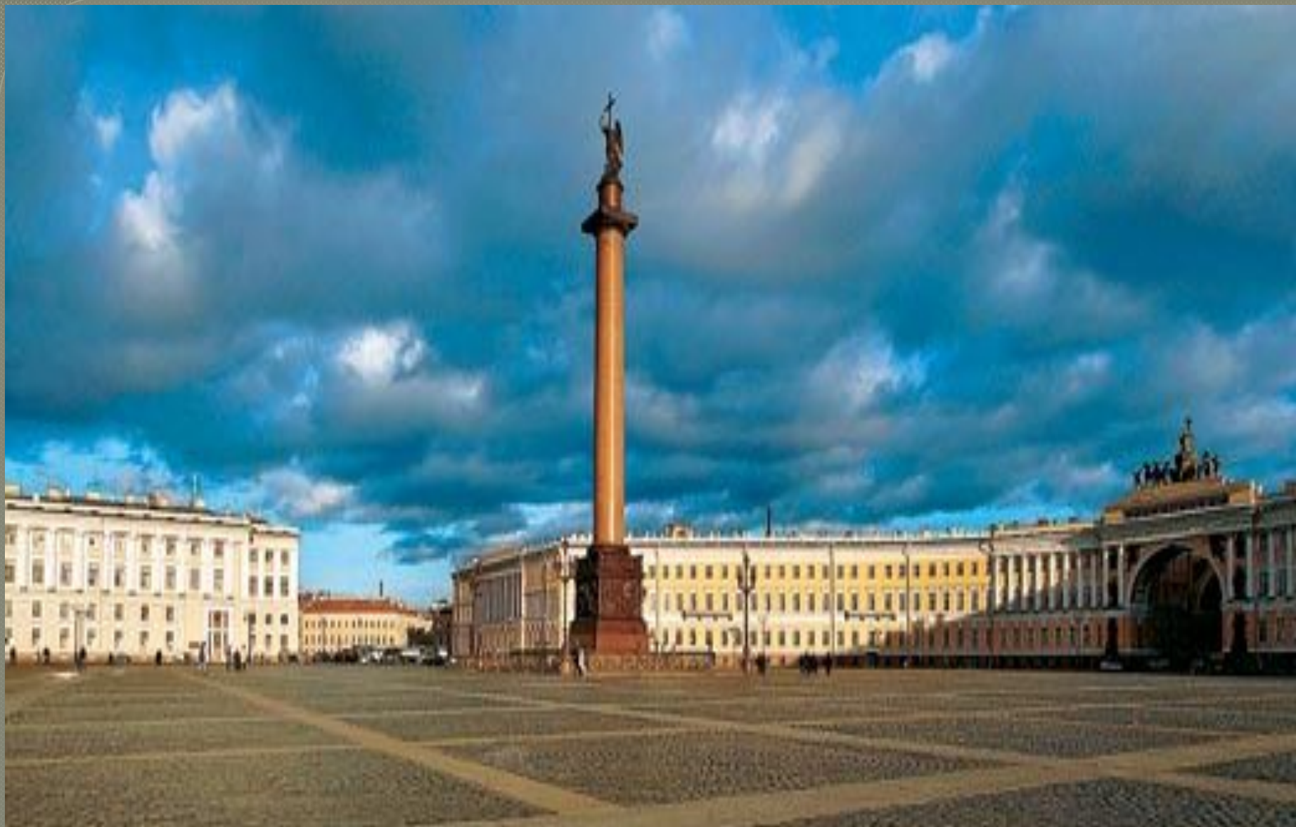
○ Александровская колонна