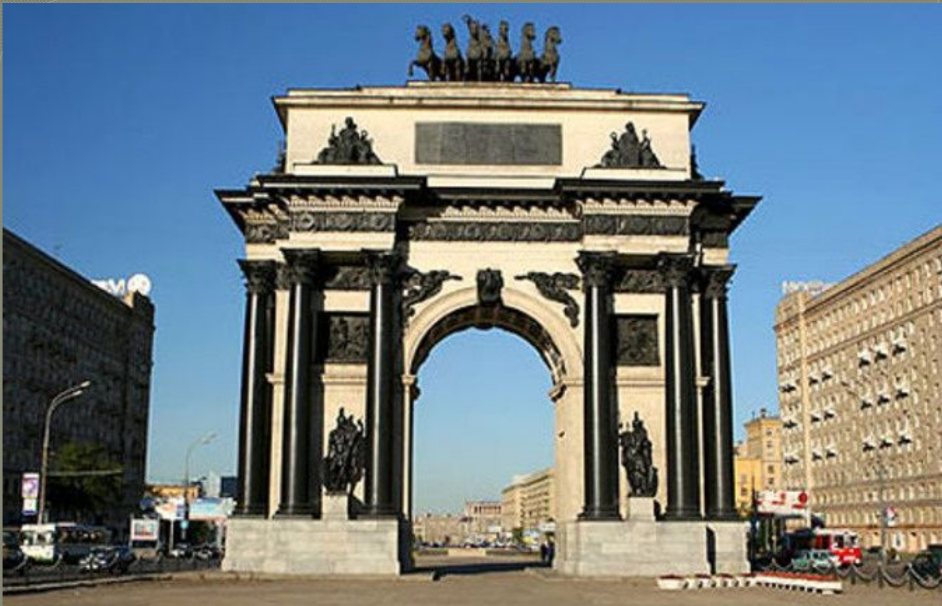
● Триумфальная арка в Москве