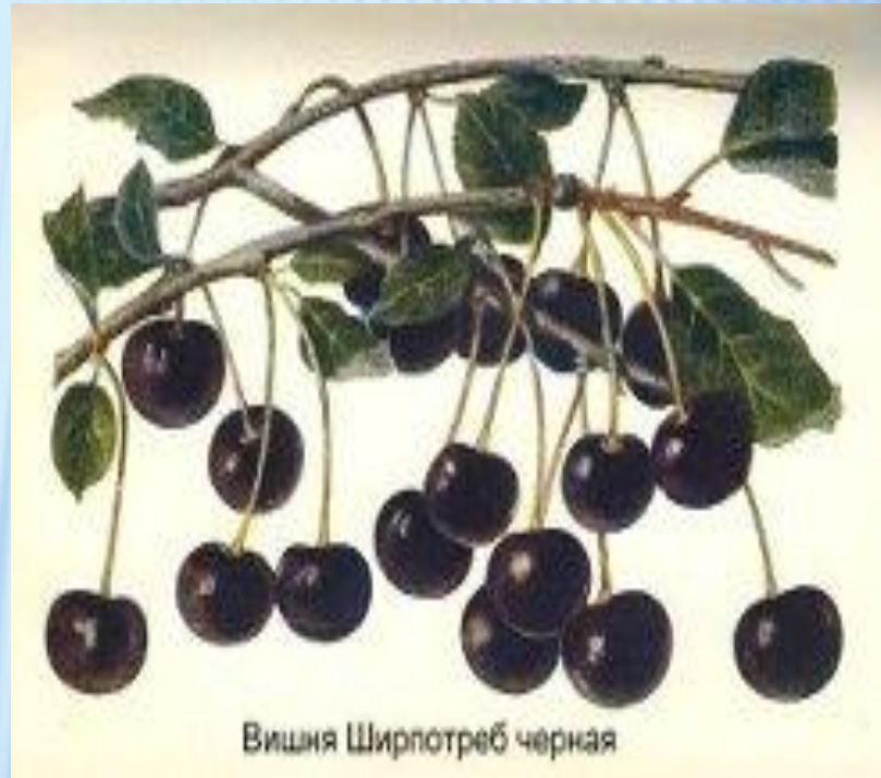
Вишня Ширпотреб черная