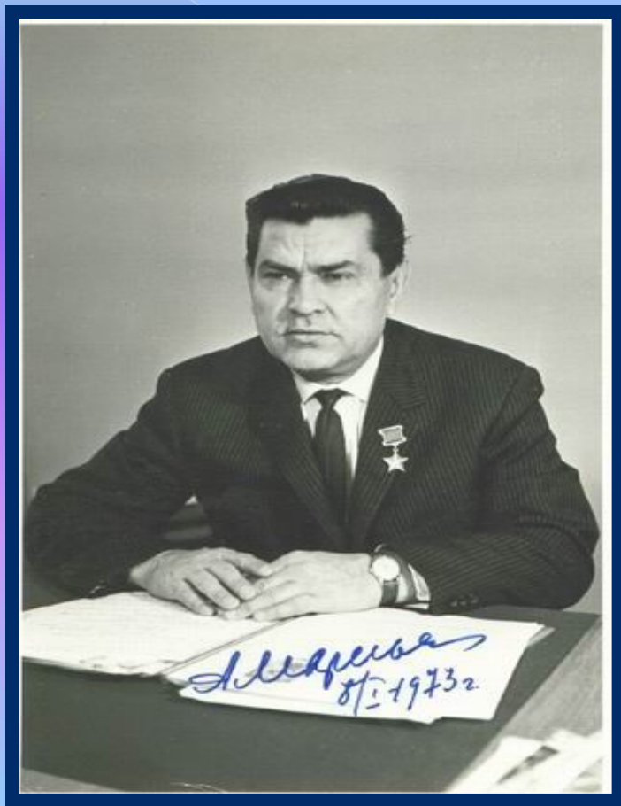
Маресьев Алексей Петрович