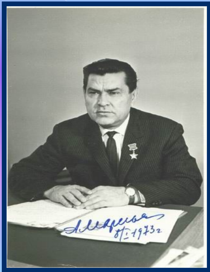
Маресьев Алексей Петрович