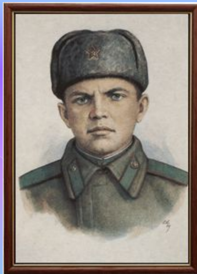
Матросов Александр Матвеевич