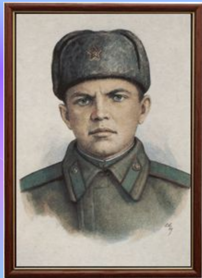
Матросов Александр Матвеевич