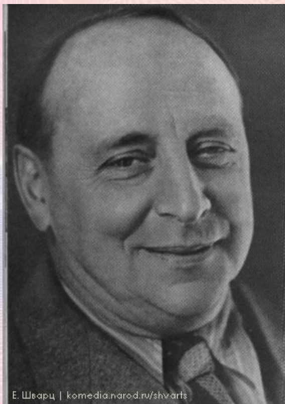
Е. Шварц | komeia.narod.ru/shvarts