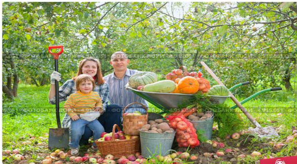
Счастливая семья возле собранного богатого урожая