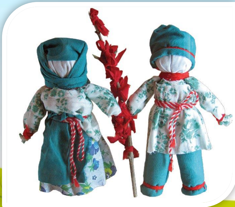
Фото отчёт о проделанной работе